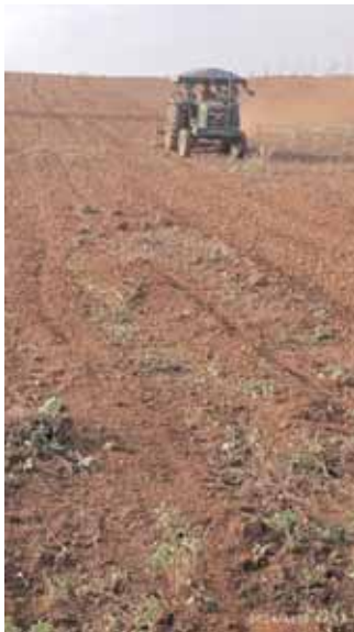
పొలంలో ట్రాక్టర్తో దున్నుతున్న దృశ్యం.

భయపడేది లేదని అన్నారు. ప్రభుత్వాలు మారడంతో కొంతమంది వైట్ కాలర్ మాఫియా ప్రభుత్వ పెద్దల అండదండలతో భూ అక్రమణలకు పాల్పడుతున్నారని మండిపడ్డారు. అక్రమార్కుల శర నుండి తమ భూమిని కాపాడాలని పోలీసులకు ఉన్నతాధికారులకు ఫిర్యాదు చేసినట్లు తెలిపారు. భూ అక్రమణలకు యత్నించే వారిపై కఠిన చర్యలు తీసుకొని పేదలకు న్యాయం చేసేలా చర్యలు తీసుకోవాలని కోరారు. ప్రభుత్వ భూములను ప్రజలను కాపాడాల్సిన వారే దౌర్జన్యంగా పేదలపై దౌర్జన్యంగా భూ అక్రమణలకు పాల్పడటం సమంజసం కాదని అన్నారు. భూ అక్రమణలకు పాల్పడేవారు ఎంతటి వారైనా ఉప్పేయడం లేదని ఎంత దూరమైన సరే వెళ్లడానికి తమ సిద్ధంగా ఉన్నామని అన్నారు.