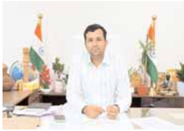
ప్రజాపాలనలో ధరఖాస్తు చేసుకున్న రసీదు తో పాటు ప్రజాపాలన సేవ కేంద్రాల వద్దకు వెళ్లి తమ ధరఖాస్తులో ఉన్న తప్పులను సరి చేసుకొని అర్హులైన అర్హులైన ప్రజా పాలన పథకాల ఫలితాలను పొందాలని ఆ ప్రకటనలో కలెక్టర్ తెలిపారు.

వికారాబాద్ జిల్లా ప్రతినిధి, మేజర్ న్యూస్ (జూన్ 28): ప్రజా పాలనలో ధరఖాస్తు చేసుకున్న లబ్ధిదారులు ఏవైనా సవరణలు చేసుకోవలసిన వారు ప్రజా పాలన సేవ కేంద్రాల్లో సరి చేసుకోవాలని జిల్లా కలెక్టర్ ప్రతీక్ జైన్ ఒక తెలిపారు. ప్రజా పాలన సేవ కేంద్రాలను మండల కేంద్రాల్లోని ఎంపీడీవో కార్యాలయంలో, మున్సిపాలిటీ పరిధిలోని మున్సిపల్ కార్యాలయంలో ఏర్పాటు చేయడం జరిగిందని ఆయన తెలిపారు. అర్హులందరికీ సంక్షేమ పథకాలు అందాలనే లక్ష్యంతో వివిధ పథకాలకు ప్రజా పాలనలో అర్హులైన నుండి ధరఖాస్తులు స్వీకరించడం జరిగిందని, కొందరు అర్హులైన ధరఖాస్తుల్లో తప్పులు దొరికిన సందర్భంగా అర్హులైన వారు లబ్ధి పొందకుండా ఉన్నారని ఆయన తెలిపారు. అర్హులైన లబ్ధిదారులకు ఇలాంటి ఇబ్బంది కలగకుండా ప్రజా పాలన పథకాల ద్వారా లబ్ధి పొందేందుకు వీలుగా