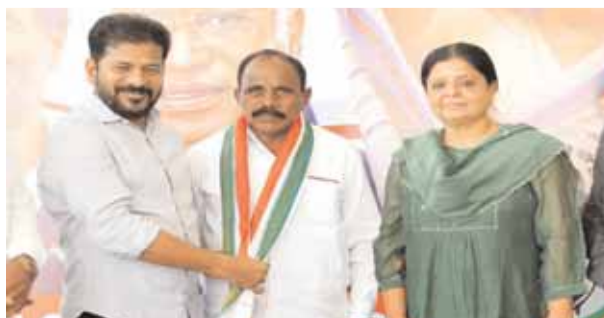
సీఎం రేవంత్ రెడ్డి సమక్షంలో కాంగ్రెస్ పార్టీలో చేరుతున్న చేవెళ్ల ఎమ్మెల్యే

చేవెళ్ల, మేజర్ న్యూస్ (జూన్ 28) : బీఆర్ఎస్ పార్టీకి మరోపాక తగిలింది. చేవెళ్ల ఎమ్మెల్యే కాలె యాదయ్య బీఆర్ఎస్ పార్టీని వీడి హస్తం గూటికి చేరాడు. డిల్లీలో సీఎం రేవంత్ రెడ్డి, తెలంగాణ రాష్ట్ర కాంగ్రెస్ పార్టీ ఇంచార్జి దీపావని మున్సి సమక్షంలో కాంగ్రెస్ పార్టీలో చేరనున్నారు. ఆయనకు సీఎం కాంగ్రెస్ పార్టీ కండువా కప్పి పార్టీలోకి ఆహ్వానించారు.