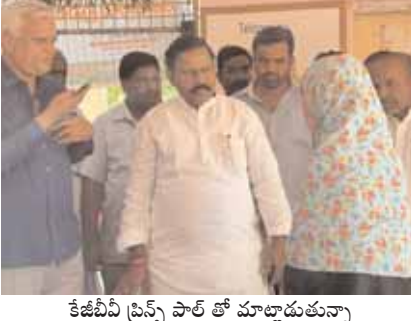
కేజీబీవీ ప్రిన్స్ పాఠ్ తో మాట్లాడుతున్నా ఎమ్మెల్యే డి ఆర్ ఆర్ పండు పచ్చివి ఉన్నాయని ఇకపై ఇలాంటివి కాకుండా మంచివి అందించాలని సంబంధిత సిబ్బందికి ఎమ్మెల్యే సూచించారు. విద్యార్థులకు నాణ్యమైన ఆహారం, మందులు ఎప్పటికప్పుడు చూసుకోవాలని వర్షాకాలం ఉన్నందున మరింత జాగ్రత్తగా ఉండాలని తెలిపారు. విద్యార్థుల భోజనం మరియు శుభ్రత లో అలసత్వం వహిస్తే సస్పెండ్ చేస్తామని ఈ సందర్భంగా హెచ్చరించారు. ఏ అవసరం ఉన్న ప్రభుత్వం తరపున సంప్రదించాలి అని పేర్కొన్నారు. ఈ కార్యక్రమంలో కాంగ్రెస్ పార్టీ నాయకులు కార్యకర్తలు పాల్గొన్నారు.