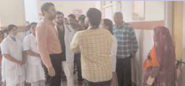
డాక్టర్లతో విద్యార్థుల ఆరోగ్య పరిస్థితి అడిగి తెలుసుకుంటున్న జిల్లా కలెక్టర్ ప్రతీక్ జైన్

పరిగి మేజర్ న్యూస్ (జూన్ 28): విద్యార్థినిలు ఎవ్వరూ అద్దైర్య పడొద్దు ఎవ్వరికీ ఏంకాదని వికారాబాద్ జిల్లా కలెక్టర్ ప్రతీక్ జైన్ బాలికలకు ధైర్యం నింపారు. పరిగి మండల పరిధిలోని నన్నల్ గ్రామంలో ఉన్న కస్తూర్బా గాంధీ