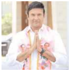
మల్లాజిగిరి ఎమ్మెల్యే మర్రి రాజశేఖర్ రెడ్డి

వర్గం అక్కడే ఉండడంతో ఇరు వర్గాల మధ్య ఉద్రిక్తత పరిస్థితులు నెలకొన్నాయి.