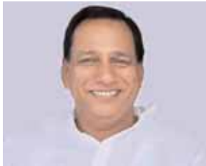
మేడ్చల్ ఎమ్మెల్యే మల్లారెడ్డి

సుచిత్ర భూ వివాదంపై చామకూర మల్లారెడ్డి ఆయన అల్లుడు మర్రి రాజశేఖర్ రెడ్డి మెడకు చుట్టుకుంది. సుచిత్ర పరిధిలోని సర్వే నెంబర్ 82లో గల 2.10 ఎకరాల స్థలం మాది అంటే మాదే అని ఎమ్మెల్యే మల్లారెడ్డి వర్గంతో పాటు మరో వర్గం మధ్య గొడవ జరిగిన విషయం విధితమే. సుచిత్ర ఏరియాలో వందల కోట్లు విలువ చేసే 2.10 ఎకరాల స్థలం మాదేనంటూ మే 18న మాజీ కార్మిక శాఖ మంత్రి, ప్రస్తుత మేడ్చల్ ఎమ్మెల్యే మల్లారెడ్డితో పాటు ఆయన అల్లుడు మల్లాజిగిరిఎమ్మెల్యే మర్రి రాజశేఖర్ రెడ్డిలు హంగామా చేశారు. వివాదాస్పద స్థలంలో ఉన్న ఫెన్సింగ్ ను తొలగించారు. ఆ సమయంలో మరో