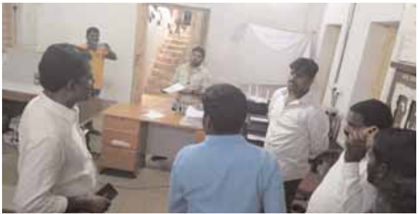
తహసీల్దార్ కార్యాలయ ఉద్యోగులతో ఆర్డీఓకు ఫిర్యాదు చేస్తున్న నేతలు