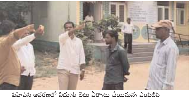
పిహెచ్సీ ఆవరణలో విద్యుత్ లైట్లు ఏర్పాటు చేస్తున్న ఎంపిటిసి