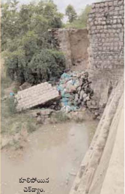
కూలిపోయిన చెక్ డ్యాం.

తాండూరు రూరల్, మేజర్ న్యూస్ (జూన్ 21): మండల పరిధిలోని గోసూర్ శివారులో ఉన్న జుంటివాగు వద్ద చెక్ డ్యాం నుంచి సాగునీరు వృధాగా పోతుంది. భారీ వర్షాలకు చెక్ డ్యాంలో వర్షపు నీరు నిలువవలసి ఉండగా.. అట్టి చెక్ డ్యాం తుమ్మాకు షటర్ లేకపోవడంతో నీరంత కిందికి వృధాగా పోతుంది. మరోవక్క చెక్ డ్యాంకు గోడ శిథిలావస్థలో చేరి కూలిపోయింది. దీంతో ఆ ప్రాంతాల్లో నీరు నిలిచే అవకాశం లేదని రైతులు పేర్కొంటున్నారు. సంబంధిత ఇరిగేషన్ అధికారులు పట్టించుకోక పోవడం లేదు. మరోవక్క ఇట్టి నీరును ఖరిఫ్ సీజన్లో రైతులు వాడుకునేందుకు వీలులే కుండాపోతుంది. ఇప్పటికైనా అధికారులు స్పందించి చెక్ డ్యాంకు మరమ్మత్తులు చేయాలని గోసూర్ రైతులు కోరుతున్నారు.