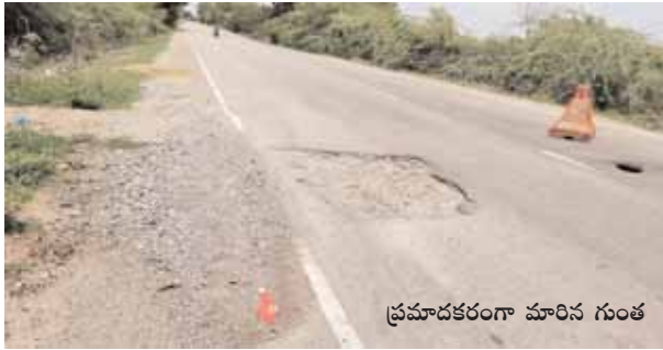
ప్రమాదకరంగా మారిన గుంత

మేడ్చల్, మేజర్ న్యూస్ (జూన్ 14) : ప్రమాదం ఎప్పుడు ఎటు నుంచి వస్తుందో తెలియదు కానీ ప్రమాదం జరుగుతదని తెలిసి జాగ్రత్త పడకపోవడం మాత్రం తప్పే. ఇందుకు ఉదాహరణనే మేడ్చల్ మండలంలోని డబిల్ పూర్ గ్రామం నుంచి నూతనకల్ కు గ్రామానికి వెళ్లే దారిలో ఇస్కాన్ దేవాలయం సమీపంలో కల్వర్ష వద్ద రోడ్డు గుంత పడి నెలలు గడుస్తున్న ప్రమాదాలు జరుగుతున్న పట్టించుకోవాల్సిన సంబంధిత శాఖ అధికారులు నిమ్మకు నీరెత్తినట్లు వ్యవహరించడం పట్ల ప్రయాణికులు, ద్విచక్ర వాహనదారులు ఆగ్రహం వ్యక్తం చేస్తున్నారు. నిత్యం వందలాది మంది ప్రయాణికులు ఇదే రోడ్డుపై నిత్యం రాకపోకలు సాగిస్తున్నారు. గతంలో పదుల సంఖ్యలో ప్రమాదాలు జరిగి తీవ్ర గాయలపాలయ్యారు. ముఖ్యంగా రాత్రి వేళలో గుంత కనిపించక ద్విచక్ర వాహనదారులు