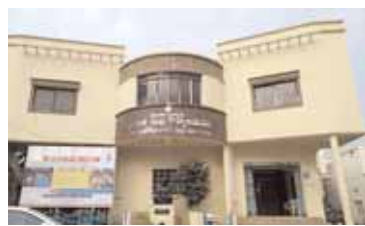
గుండ్లపోచంపల్లి పురపాలక సంఘం