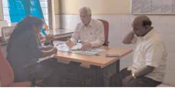
విచారణ చేస్తున్న అధికారులు. వికారాబాద్, మేజర్ న్యూస్ (జూన్ 15): కాలం చెల్లిన ట్యాబ్లెట్లు ఇచ్చిన