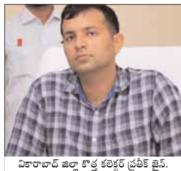
వికారాబాద్ జిల్లా కొత్త కలెక్టర్ ప్రతీక్ జైన్.

వికారాబాద్ జిల్లా ప్రతినిధి, మేజర్ న్యూస్ (జూన్ 15): వికారాబాద్ జిల్లా కలెక్టర్ సి.నారాయణరెడ్డి ని బదిలీ చేస్తూ రాష్ట్ర ప్రభుత్వం శనివారం ఉత్తర్వులను జారీ చేసింది. 2023వ సంవత్సరం, ఫిబ్రవరి రెండో తేదీన ఆయన వికారాబాద్ జిల్లా కలెక్టర్ గా బాధ్యతలు చేపట్టారు. ఆయన బాధ్యతలు చేపట్టిన వెంటనే జిల్లాలో గాడితప్పిన పరిపాలనను గాడిలో పెట్టి కార్యక్రమానికి మొదటి ప్రాధాన్యతనిచ్చారు. ప్రతి సోమవారం ప్రజామాణి కార్యక్రమం నిర్వహించి ప్రజల నుంచి వచ్చే దరఖాస్తులను స్వయంగా స్వీకరించారు. ఈ ప్రజామాణి కార్యక్రమానికి తనతోపాటు అన్ని శాఖల జిల్లా అధికారుల పాల్గొనేలా చర్యలు తీసు కున్నారు. దీంతో క్రమేనా ప్రజా సమస్యలు తగ్గుముఖం పట్టాయి. మిగతా 2లో