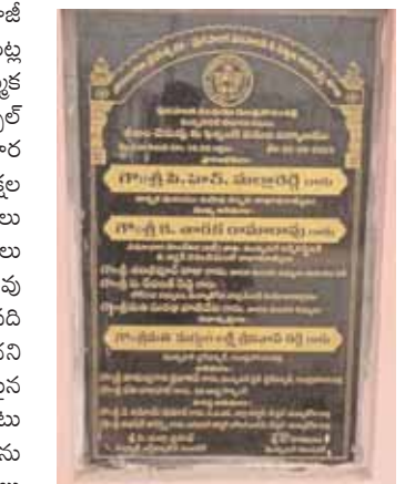
నీలం చెరువు చుట్టూపక్కల ఫెన్సింగ్ పనులు ప్రారంభిస్తున్నట్లు ఏర్పాటు చేసిన శిలాఫలకం