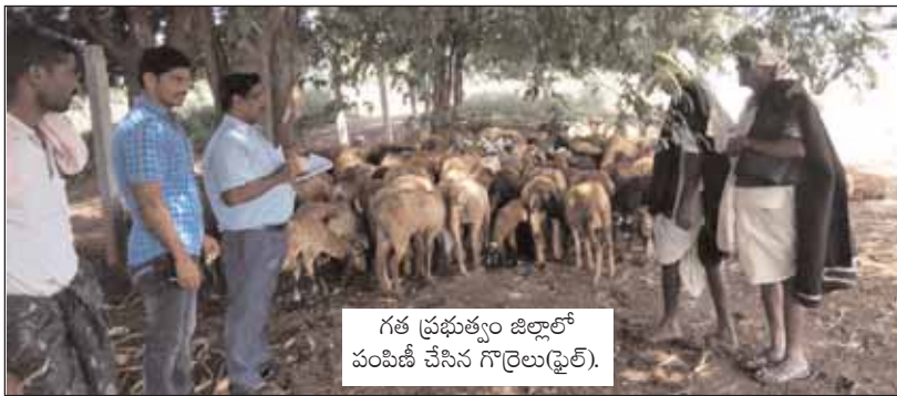
గత ప్రభుత్వం జిల్లాలో పంపిణీ చేసిన గొర్రెలు(ఫైల్).

వికారాబాద్ జిల్లా ప్రతినీధి, మేజర్ న్యూస్ (జూన్ 16): మాంసం ఉత్పత్తిని పెంచడం తోపాటు పశువుల కాపరుల ఉపాధి అవకాశాన్ని పెంపొందించడానికి గత బీఆర్ఎస్ ప్రభుత్వంలో గొర్రెల సమగ్ర అభివృద్ధి, పంపిణీ పథకంలో వికారాబాద్ జిల్లాలో భారీ అవినీతి చోటు చేసుకుంది. గత ప్రభుత్వ హయాంలో రెండు విడుతలుగా గొర్రెలను పంపిణీ చేశారు. మొదటి విడుతలో యూనిట్ కాస్ట్ 1,25,000 రూపాయలుండగా, దీనిలో లబ్ధిదారుల వాటా 25 శాతం 31,250 రూపాయలు కాగా, 75 శాతం ప్రభుత్వ వాటా 93,750 రూపాయలుగా నిర్ధారించింది. మొదటి