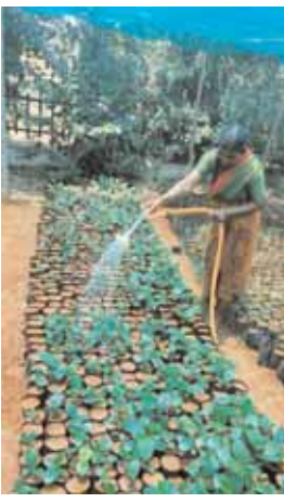
మొక్కలు నీరు పోస్తున్న దృశ్యం.

జిల్లాలో భూముల విలువ ఆకాశానంటంతో ధరలు అందనంత దూరంలో పెరిగాయి. దీంతో ప్రభుత్వ, అప్రెన్స్, అటవీ, చెరువు శిఖం భూములు అన్యక్రంతమవుతున్నాయి. మరో వైపు ప్రభుత్వస్థలాలనూ అక్రమార్కులు వదల టం లేదు. వీటిని రక్షించేందుకు అవసరాలు నిమిత్తం సేకరించిన భూముల్లో మొక్కలు నాటనున్నారు. ప్రభుత్వ కార్యాలయాలు, పారిశ్రామిక ప్రాంతాలలో కూడా మొక్కలు నాటేందుకు చర్యలు తీసుకుంటున్నారు. సామూహిక వనాల పెంపకానికి స్థలసేకరణ లో ఆయా శాఖల అధికారులు నిమగ్నులయ్యారు. గ్రామీణ ప్రాంతాల్లో ఉపాధి హామీ కులీలు మొక్కలు నాటేందుకు గుంతలు తవ్వకాల పనులు చేపడుతున్నారు. అర్బన్ పార్కు లు సహా పట్టణాలు, గ్రామాల్లో గుంతల తవ్వకాల పనులు ముమ్మరంగా చేపడుతున్నారు. మేడ్చల్ జిల్లాలో చాలా ప్రాంతం పట్టణ ప్రాంతంగా మారడంతో.. చిన్నచిన్న కారు రైతుల వ్యవసాయ క్షేత్రాల్లో అలాగే పండ్ల తోటలలో ప్రతి మండలంలో సుమారు 50 ఎకరాల్లో ప్రత్యేకంగా మొక్కలు నాటేందుకు ప్రణాళికలు సిద్ధం చేస్తున్నారు.