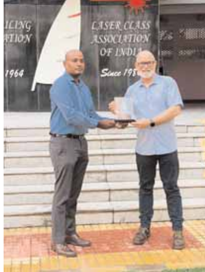
ఆల్వాల్, మేజర్ న్యూస్ : ఈ. ఎమ్. ఈ., సెయిలింగ్ అసోసియేషన్ (ఈ. ఎమ్ ఈ. ఎస్. ఎ.) భారతదేశంలో మొదటి అంతర్జాతీయ కొలతల (ఐ. ఎమ్ ) క్లినిక్ని 2024 జూన్ 15 నుండి జూన్ 16 వరకు విజయవంతంగా పూర్తి చేసినట్లు సగర్వంగా ప్రకటిస్తున్నందుకు ఆనందంగా ఉండంటూ . లెఫ్టినెంట్ జనరల్ సీరజ్ వర్మి, వి. ఎస్. ఎమ్., కమాండెంట్ నేతృత్వంలో జరిగిన ఈ మైలరావి ఈవెంట్ ఎమ్. సి. ఈ. ఎమ్. ఈ