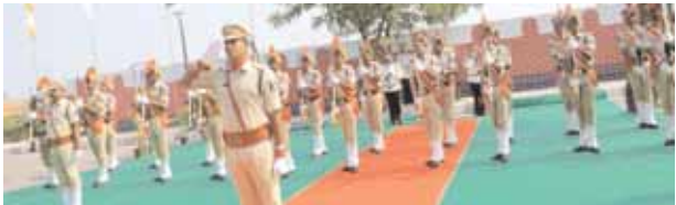
గౌరవ వందనం చేస్తున్న పోలీస్ అధికారులు

అభివృద్ధి జాబలో నడిపేందుకు అందరూ ముందుకు రావాలన్నారు. తెలంగాణ ప్రజలు కలలుగని దాన్ని పురోగమన దిశగా తీర్చిదిద్దేందుకు కృషి చేయాలన్నారు. అన్ని సామాజిక వర్గాల ప్రజల ఆకాంక్షలకు అనుగుణంగా, గ్రామీణ పట్టణాలు, నగర ప్రాంతాలకు సమ ప్రాధాన్యతనిస్తూ సమగ్రాభివృద్ధికి, సంక్షేమ పథకాలు అమలు చేస్తున్నామని తెలిపారు. ప్రభుత్వ ఉద్యోగులందరూ జిల్లా అభివృద్ధికి పున రాంకితులై అన్ని రంగాల్లో ముందుకు నడిపేందుకు తమ