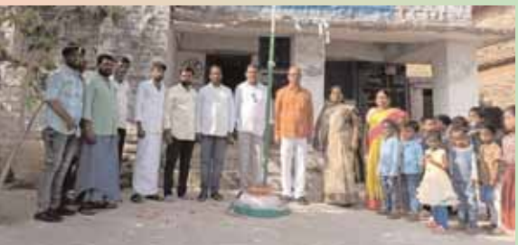
ఉడిమేశ్వరంలో ఆవిర్భావ దినోత్సవంలో అధికారులు, ప్రజాప్రతినిధులు, ఉపాధ్యాయులు

కొడంగల్, మేజర్ న్యూస్ (జూన్ 2): ప్రత్యేక తెలంగాణ రాష్ట్ర 11వ ఆవిర్భావ దినోత్సవ వేడుకల్లో భాగంగా కొడంగల్ తో పాటు మండలంలోని వివిధ గ్రామాల్లో ప్రత్యేకాధికారులు, ప్రజాప్రతినిధులు జాతీయ జెండాలను ఎగరవేశారు.