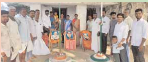
సంగాయిపల్లిలో ఆవిర్భావ దినోత్సవంలో అధికారులు, ప్రజాప్రతినిధులు