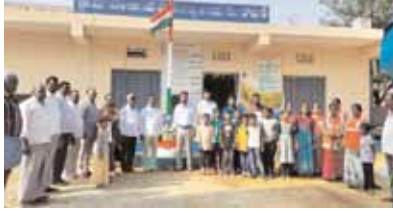
పంచాయతీ కార్యదర్శులు జాతీయ పతాకాన్ని ఆవిష్కరించారు.