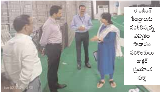
కౌంటింగ్ కేంద్రాలను పరిశీలిస్తున్న ఎన్నికల సాధారణ పరిశీలకులు డాక్టర్ ప్రియాంక శుక్లా

ఎన్నికల సాధారణ పరిశీలకులు డాక్టర్: ప్రియాంక శుక్లా