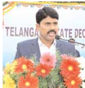
జిల్లా కలెక్టర్ సి.నారాయణ రెడ్డి ఆదేశం

ఉంచడానికి సిద్ధంగా ఉన్నామని అన్నారు. రైతులు అప్రమతంగా ఉండాలని, రైతులు, విత్తనాల విషయంలో ఏమైనా సందేహాలు ఉంటే వెంటనే సమచారమివ్వాలని, వ్యవసాయాధికారిని సంప్రదించాలని కోరారు. ఎక్కడైనా నిబంధనలు ఉల్లంఘించి నకిలీ విత్తనాలు విక్రయిస్తే దుకాణాల యజమానులపై చట్టపరమైన కఠిన చర్యలు తీసుకోవడంతో పాటు పి డి యాక్ట్ కేసులు నమోదు చేస్తామని ఆయన హెచ్చరించారు. డీలర్లందరూ విత్తన చట్టానికి లోబడి, నిబంధనలను అనుసరిస్తూ వ్యాపారం నిర్వహించాలని, ఎట్టి పరిస్థితుల్లోనూ నకిలీ విత్తనాల విక్రయాలు చేయరాదని తెలిపారు.