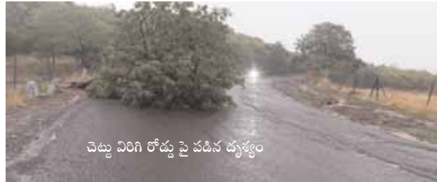
చెట్టు విరిగి రోడ్డుపై పడిన దృశ్యం

ధారూర్, మేజర్ న్యూస్ (జూన్ 2): వికారాబాద్ జిల్లా కేంద్రం నుండి ధారూర్ వైపుగా బుగ్గి రామలింగేశ్వర మీదుగా వచ్చే క్రింది రోడ్డు అనంతగిరి అడవి ప్రాంతంలో ఓ చెట్టు రోడ్డుకు అడ్డంగా పడిపోయింది. ఇది కాకుండా చెరువు సమీపంలో ప్రధాన రోడ్డుపై అక్కడక్కడ కొన్ని చెట్లు రోడ్డుకు అడ్డంగా పడడంతో అటుగా వస్తున్న వాహనదారులు ప్రమాదాలకు గురవుతున్నారని ప్రజలు తెలిపారు. ఇవే కాకుండా వారం రోజుల క్రితం రోడ్డుకు అడ్డంగా ఎబ్బానూర్ చెరువు సమీపంలో పడి ఉన్న అధికారులు మాత్రం దానిని తొలగించగా పోవడంతో ప్రయాణికులు ప్రమాదాలకు గురయ్యారు ఇప్పటికైనా సంబంధిత అధికారులు స్పందించి ప్రయాణికుల సమస్యను తీర్చాలని ప్రజలు కోరుతున్నారు.