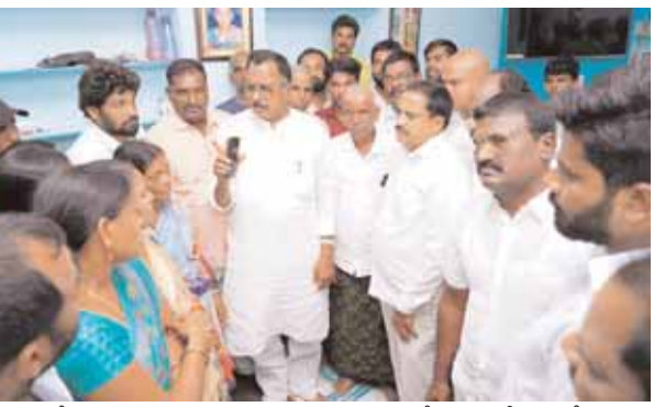
కడ్రాల్, మేజర్ న్యూస్ ( జూన్ 11): కడ్రాల్ మండల కేంద్రం సమీపంలోని బటర్ ఫైసిటీ వేంచరిలో గల ఓ విల్లాలో ఇటీవల హత్యకు గురైన గోవిందయపల్లి

- బాధిత కుటుంబాలకు రూ.20వేల ఆర్థిక సహాయం అందజేత