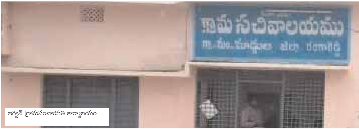
ఇర్విన్ గ్రామపంచాయతి కార్యాలయం

మాడ్చల, మేజర్ న్యూస్ (జూన్ 11): 2019 గ్రామపంచాయతి ఎన్నికల్లో సర్పంచ్లు, ఉపసర్పంచ్లు, వార్డుసభ్యులుగా పనిచేసినవారిలో అత్యధికాలు గ్రామపంచాయతి ఎన్నికలు అనగానే వామో మాకొద్దు ఈ పదవులు, ఊరికి చేసిన ఉపకారం, శవానికి చేసిన సింగారం ఒక్కటే అంటూ జడుసుకుంటున్నారు. సర్పంచ్లు, వార్డుసభ్యుల పదవీకాలం ఈయేదాది ఫిబ్రవరిలో ముగిసిపోగా ప్రభుత్వం గ్రామపంచాయతిల పాలన ప్రత్యేక అధికారులకు అప్పగించిన విషయం విధితమే. రాష్ట్రంలో కులగణన జరుపాలని ప్రస్తుత కాంగ్రెస్ ప్రభుత్వం అసెంబ్లీలో తీర్మాణం చేయగా అందుకు అన్ని రాజకీయపార్టీలు మద్దతు పలికాయి. దీంతో ప్రభుత్వం యుద్ధప్రాతిపదికన కులగణన పూర్తి చేయాలన్నా కనీసంగా మూడు నుండి నాలుగు నెలలు పడుతుందని, 2024లో జరుగాల్సిన గ్రామపంచాయతి, ఎంపి పోటీ, జడ్పిటీ పోటీ ఎన్నికలు ఇప్పట్లో లేనట్లన్న వాదనలు కూడ వినిపిస్తున్నాయి. అదే విధంగా గతంలో ఉన్న రిజర్వేషన్లతోనే స్థానిక ఎన్నికలు జరిపితే సర్పంచ్ బరిలో నిలిచేందుకు మండలంలోని వివిధ గ్రామాలలో యువతరం సై అంటే సై అంటూ గత రెండు మూడు నెలల నుండి వివిధ సేవా కార్యక్రమాలతో ఓటర్లను ప్రసన్నం చేసుకునేందుకు ముమ్మర ప్రయత్నాలు సాగిస్తున్నారు. ఈ నేపథ్యంలో సర్పంచ్లు, వార్డుసభ్యులుగా గత ఐదేండ్ల పదవీకాలంలో ప్రజలకు అందుబాటులో ఉంటూ స్థానికంగా తాగునీరు, పారిశుధ్య, విద్యుత్తు వంటి మౌళిక వసతుల కల్పన మొదలుకొని ప్రభుత్వ మార్గదర్శకాల మేరకు లక్షల