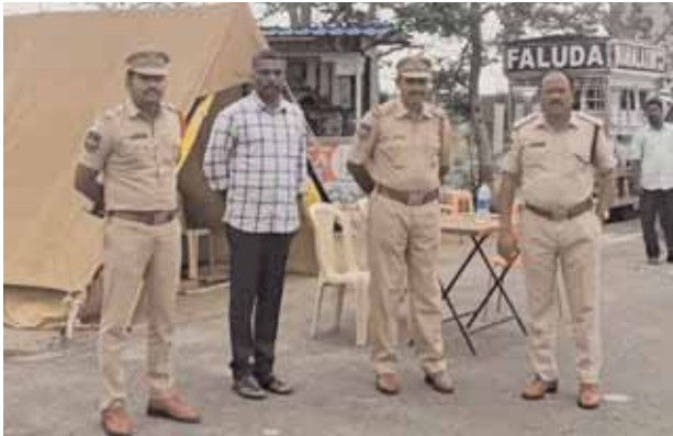
చెక్ పోస్టు వద్ద పోలీస్ నిఘా