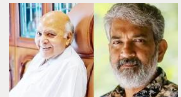
రామోజీకి 'భారతరత్న' ఇవ్వడమే అసలైన నివాళి - రాజమౌళి

స్టార్ డైరెక్టర్ ఎన్ఎస్.రాజమౌళి, ప్రముఖ సంగీత దర్శకుడు ఎం.ఎం.కీరవాణి రామోజీ మౌనపాఠానికి తమ అత్యున్నత నివాళి అర్పించారు. ఈ సందర్భంగా మీడియాతో మాట్లాడిన రాజమౌళి... "వి రంగంలో అయినా తనకంటూ ఓ ప్రత్యేక ముద్రను వేసుకుని, గెలుపు తలుపులు తట్టిన మహనీయుడు రామోజీ రావు.. ఎన్నో సంస్థలను నెలకొల్పి, సరికొత్త ఆలోచనలతో వాటిని, తినిపాలకు తీసుకెళ్లిన ఒకే ఒక వ్యక్తి రామోజీ రావు.. ఆయనకు భారతరత్న ను అందించడమే మనం ఇవ్వగలిగే అసలైన నివాళి.."