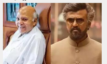
రాజకీయాల్లో రామోజీరావు కింగ్ మేకర్: రజనీకాంత్