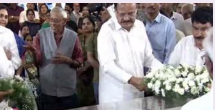
రామోజీరావు వ్యక్తి కాదు.. శక్తిమంతమైన వ్యవస్థ; వెంకయ్యనాయుడు రామోజీరావు స్వయంకృషితో కష్టపడి ఆనేక రంగాల్లో విజయం సాధించారని మాజీ ఉపరాష్ట్రపతి వెంకయ్యనాయుడు కొనియాడారు. రామోజీ పాపవదహానికి వెంకయ్యనాయుడు నివాళులు అర్పించారు. అనంతరం కుటుంబసభ్యులకు ప్రగాఢ సానుభూతి తెలియజేశారు. "ఒక అఖండ తెలుగు జ్యోతి ఆరిపోయింది. ఒక ధ్రువతారలా నిరంతరం వెలుగుతూ ఉంటారు. ఆయన చేపట్టిన కార్యక్రమాలు భవిష్యత్తు తరాలకు ఆదర్శం. రామోజీరావు ఒక పాటకు యోధుడు" అని వెంకయ్యనాయుడు కొనియాడారు.

రాజేంద్రప్రసాద్ నటించిన దాగుడుమూత దండారో సినీమా వచ్చింది. కేవలం పెద్ద తెరకు మాత్రమే పరిమితం కాకుండా బుల్లితెరపై తన సత్తా చూపించారు. భాగవతం, అన్నపూర్ణ, ఎండమావులు, ఆడపిల్ల, పంచతంత్రం లాంటి బ్లాక్ బస్టర్ ధారావాహికలను అందించారు. కాలంతో పాటు మారుతూ.. రీసెంట్ గా ఓటీటీలో కూడా ఎంట్రి ఇచ్చారు రామోజీ రావు. ఈనాడు గ్రూప్ నుంచి వచ్చిన ఓటీటీ వేదిక ఈటీవీ ఐన్. కేవలం తెలుగు సినీమాతో పాటు తెలుగు ధారావాహికలూ, ప్రోగ్రామ్స్ ఈ ఓటీటీలో ప్రసారం అవుతుంటాయి.