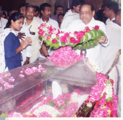
రామోజీ రావు స్వగ్రామంలో విషాదభాయలు