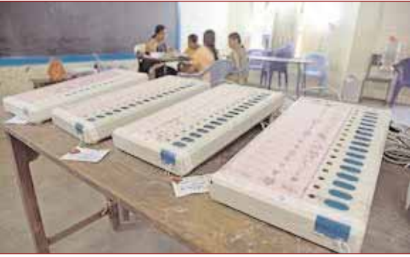
ఎక్కువగా ఓట్లు లెక్కించిన -3 ప్రధాన స్థానాలు: 1. కరీంనగర్ (అస్సాం): పార్లమెంటరీ నియోజక వర్గంలో లెక్కించిన ఓట్లు 11,40,349, పోలైన ఓట్లు 11,36,538. ఈ రెండింటికీ తేడా 3,811. 2. అంగోలం (ఆంధ్ర ప్రదేశ్): ఈ నియోజక వర్గంలో లెక్కించిన ఓట్లు 14,01,174, పోలైన ఓట్లు 13,99,707. తేడా 1,467. 3. మండలవర్గ ప్రదేశ్): ఈ పార్లమెంటరీ నియోజక వర్గంలో మొత్తం లెక్కించిన ఓట్లు 15,31,950. కాగా పోలైన ఓట్లు 15,30,861 తేడా 1,089.

పుడ, డిఫినెంట్ కల్పిత సూనెలు ఎక్కువగా వినియోగిస్తున్నారు. పానీ పూరి చేసే ఇళ్లలో పండ్లు కూడా కనిపించవు. ఫ్రూట్ సలాడ్, ఐస్ క్రీమ్, ఐస్, నూడులు కనిపించు చేసే ప్రదేశాల్లో చవి తుగ్గత పాటించక అవి తిన్న వారు అనారోగ్యాన్ని కొని తెచ్చుకుంటున్నారు. ఫుడ్ ఇన్సెక్టుల ప్రతి రోజు తనిఖీ చేయాలి, తయారీ కేంద్రాలను పరిశీలించాలి, అప్పుడు వ్యాపారంలో రంగుల వాడకాన్ని, కల్పిత పాల వాడకాన్ని నియంత్రించి తగిన చర్యలు తీసుకోవాలి. మన చేతిలో లేని పరిస్థిరాల విషయానికే వస్తే ప్రైవేటు గిట్టుబాటు ధరలు ఇష్టాన్ని తగ్గి, కల్పిత పాలను తినుకోవాలి, అలాగే రేట్లు ఇంకా ఇంకా పెరుగుతాయి. కల్పిత ప్రచారం విస్తృతంగా పెరగాలి. వాటి పల్ల కీడు ప్రజలకు తెలియజేయాలి. ఫెర్టిలైజర్లు వాడకం, కాన్సర్ల కారణం అనే విషయాన్ని కూడా తెలియజేయాలి. ఆరోగ్య తనిఖీ