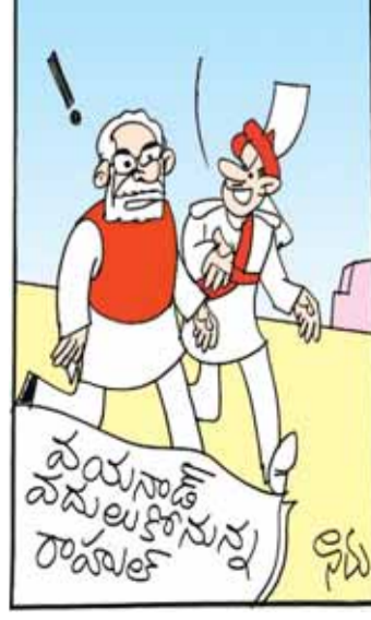
మీలాగే రావాలి కూడా ఉత్తర భారతాన్ని కోరుకుంటున్నారని సారీ