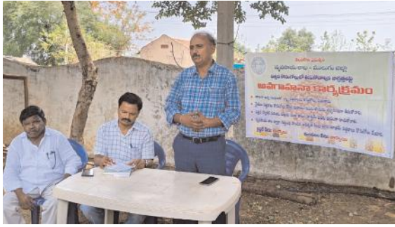
విత్తనల కొనుగోలు విషయంలో