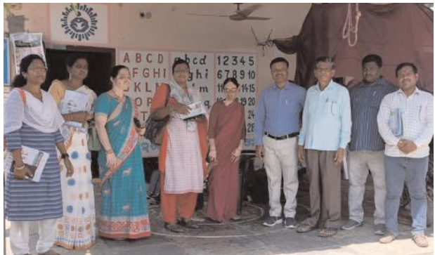
కేసముద్రం, జూన్ 11, మేజర్ న్యూస్ (సూర్య): ప్రొఫెసర్ జయశంకర్ బాడిబాట కార్యక్రమంలో భాగంగా మంగళవారం కేసముద్రం స్టేషన్ జడ్చీ హైస్కూల్ ఉపాధ్యాయులు కేసముద్రం స్టేషన్, అమీనాపురం గ్రామాలలో బడి ఈడు పిల్లలను బడిలో చేర్చించండి అంటూ ఇంటింట ప్రచారం