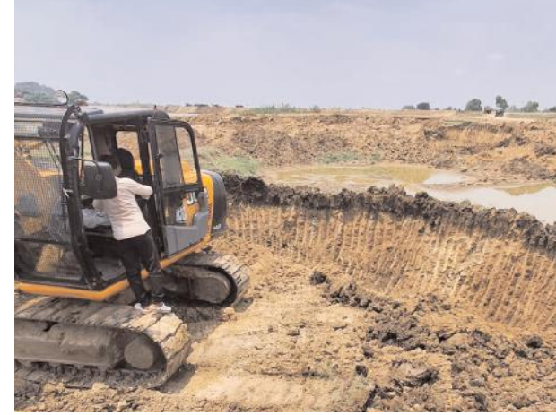
చర్యలు తీసుకోవాలని స్థానికులు, రైతులు కోరుతున్నారు.

పర్యవేక్షణ (జూన్ 13) సూర్య న్యూస్: పర్యవేక్షణ మండలం ఏనుగల్లు పెద్ద చెరువు, సాకరి బోర్డు (గుట్ట) వద్ద అక్రమ మొరం దండాపై ఇరిగేషన్ ఆఫీసర్లు ఎట్టకేలకు గురువారం సంఘటన ప్రదేశాలను సందర్శించారు. ప్రస్తుతం మొరం తవ్వకాలను నిలిపివేసినట్లు ఐటి డి ఈ. రాజు తెలిపారు. తమ సిబ్బందిని అక్కడికి పంపించినట్లు పర్యవేక్షణ తీసుకున్న తర్వాతే వర్క్ చేసుకోమని చెప్పినట్లు వివరించారు. గత 15 రోజుల నుంచి ఎటువంటి అనుమతి లేకుండా ఓ కాంట్రాక్టర్ కట్ట వెడల్పు కోసం మొరం వాడుకోవడం, మట్టి వ్యాపారులు రాత్రిపూట మట్టిని అమ్ముకోవడం పై వివరణ కోరగా... జరిగింది గురించి వదిలిపెట్టండి... ప్రస్తుతం పిఆర్ నుంచి పర్యవేక్షణ తీసుకుంటూ అప్పుడే మట్టి తరలించుకోమని చెప్పామని తెలిపారు. కాగా ఇదంతా ఇరిగేషన్ ఆఫీసర్లకు తెలిసే నడుస్తుందని, అయినా సంబంధిత కాంట్రాక్టర్, మట్టి వ్యాపారులపై ఇరిగేషన్ ఆఫీసర్లు ఎటువంటి చర్యలు తీసుకోకపోవడం విద్వేషంగా ఉందని స్థానికులు ఆగ్రహం వ్యక్తం చేస్తున్నారు. ఇరిగేషన్ ఆఫీసర్లు లంచాలు తీసుకుని డిపార్ట్మెంట్ కు వచ్చే రెవెన్యూ ను నష్టపరుస్తున్నారని గ్రామస్థులు ఆగ్రహం వ్యక్తం చేస్తున్నారు. జిల్లా ఆఫీసర్లు స్పందించి సంబంధిత కింది స్థాయి ఇరిగేషన్ ఆఫీసర్లు, కాంట్రాక్టర్ , అక్రమ మట్టి వ్యాపారుల పై