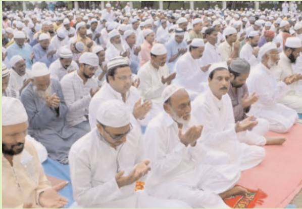
పెంపొందించటానికి ఒక పండుగను 'దానాల పండుగ' అని.. మరొక పండుగను 'త్యాగాల పండుగ' అని నిర్దేశించటం జరిగింది.

చెన్నారావుపేట జూన్ 16 (సూర్య మేజర్ న్యూస్): త్యాగానికి ప్రతీకగా ముస్లిం సోదరులు బక్రీద్ పండుగ వేడుకలను ఘనంగా నిర్వహిస్తారు. ప్రతి ఏడాది ముస్లింలు అత్యంత వైభోపితంగా నిర్వహించుకునే పండుగలలో రంజాన్ తర్వాత అత్యంత ముఖ్యమైనది బక్రీద్. నేడు సోమవారం ముస్లింలు అత్యంత భక్తి శ్రద్ధలతో బక్రీద్ వేడుకలను నిర్వహించుకున్నారు. 'బక్రీద్' అంటే ముస్లిములు మేకలను, గొర్రెలను, ఆవులను బలిచ్చి బిర్యానీలు వండుకు తినే పండుగన్నది చాలా మంది ముస్లిమేతరుల భావన.. నిజానికి 'బక్రీద్' పండుగ అసలు పేరు ఈదుల్ ఆద్ హా' అంటే 'త్యాగాల పండుగ' అని అర్థం. దీనికి రెండు నెలల ముందు వచ్చే మరొక పండుగ 'రంజాన్ దీని అసలు పేరు 'ఈదుల్ ఫితర్ అంటే దానాల పండుగ'. ఈ విధంగా ఇస్లాం నిర్దేశించే రెండు పండుగల్లో మొదటిది దానాల' విస్తృతంగా చేస్తూ నిర్వహించుకునే పండుగ రంజాన్ అయితే... రెండవది 'త్యాగం' చేస్తూ నిర్వహించుకునే మరొక పండుగ బక్రీద్.. ఈ రెండు పండుగలు తప్ప ముస్లిం సమాజంలో కొందరు జరుపుకునే పండుగలకు ఇస్లాంతో ఏమాత్రం సంబంధం లేదన్న విషయాన్ని గమనించాలి. 'త్యాగాల పండుగ' ఈ పదం వినటానికి, చదవటానికి చాలా ఆశ్చర్యంగా ఉంది కదూ! ఎందుకంటే 'పండుగ' అంటే ఇంటిల్లిపాది కొత్త బట్టలు, రుచికరమైన ఆహారాలు వండుకు తింటూ సంతోషంగా గడవటం అన్నదే అందరికీ తెలిసింది. కాని ఇస్లాం దీనికి పూర్తి భిన్నంగా మీ ఇంటిల్లిపాది జరుపుకునే పండుగలలో అగత్యపరులు, అవసరార్థాలు, బీదలను, మీ దగ్గరి బంధువులను, మీ ఇరుగు పొరుగువారిని కూడా మీ సంతోషంలో భాగస్వాములుగా చేసుకుని వారికి మీకు కలిగి ఉన్నంతలో దానమిచ్చి, మీరు తినే దానిలో వారిని కూడా భాగస్వాములుగా చేసుకుని పండుగ చేసుకోవలసిందిగా ఆజ్ఞాపిస్తుంది. అందుకే ప్రతీ వ్యక్తి ప్రవృత్తిలో దాన గుణాన్ని 'త్యాగనిరతిని'