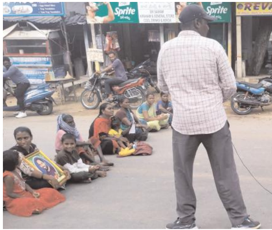
ఇసుక లారీలతో మృత్యువాత పడిన బాధిత కుటుంబాలకు న్యాయం చేయాలి