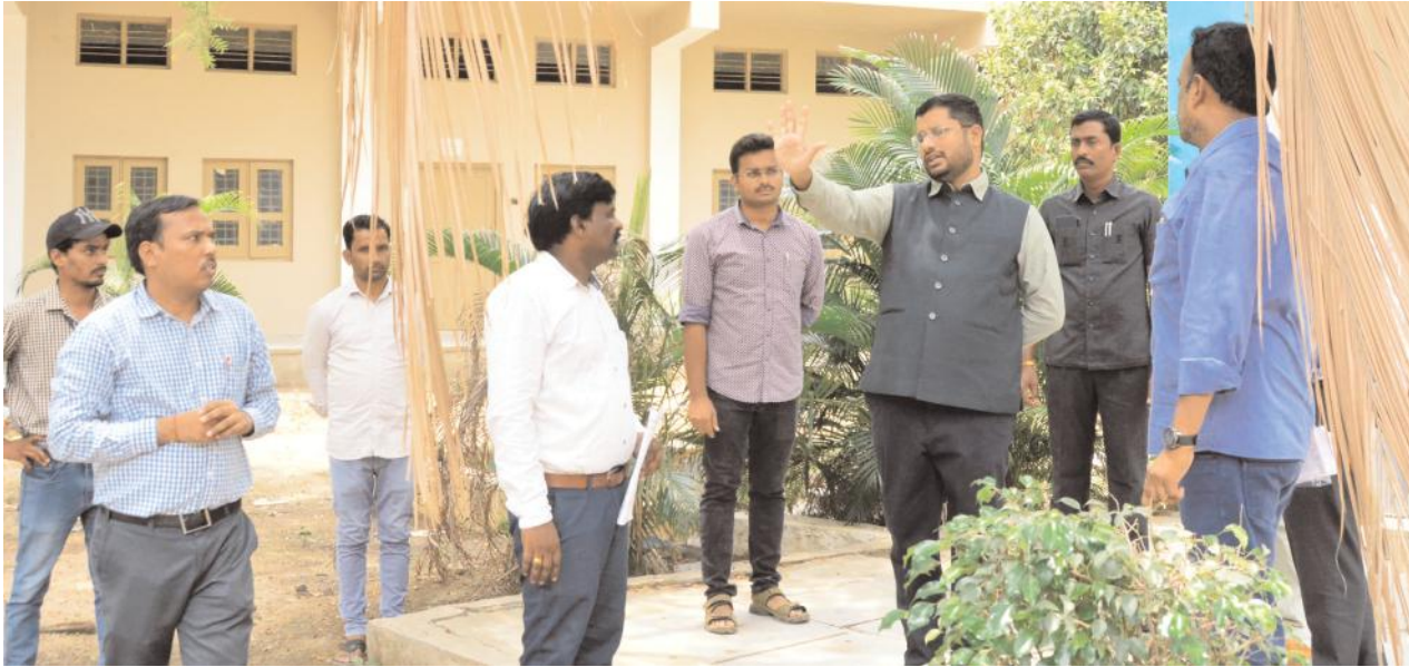
పరీక్ష రాసే అభ్యర్థులు చెప్పులు మాత్రమే ధరించాలి

గ్రూప్-1 ప్రిలిమ్స్ పరీక్షకు 14 కేంద్రాల్లో 3,697 మంది అభ్యర్థులు