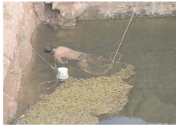
ప్రమాదవశాత్తు బావిలో పడి రైతు మృతి