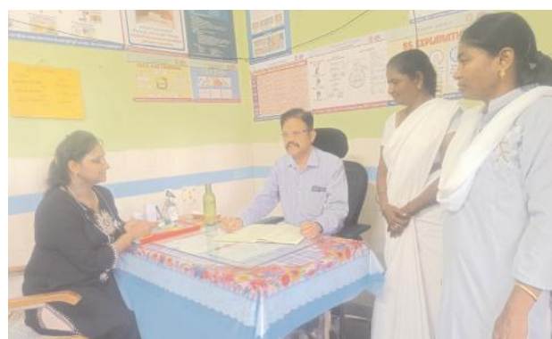
సేవలు అందించాలని ఆదేశించారు.కార్యక్రమంలో వైద్య సిబ్బంది పాల్గొన్నారు.