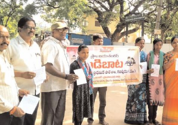
గణపురం జూన్ 06 మేజర్ న్యూస్ సూర్య: ప్రభుత్వ పాఠశాలల్లో కల్పించే సౌకర్యాలను సద్వినియోగం చేసుకోనిబడి ఈడు పిల్లలను ప్రభుత్వ