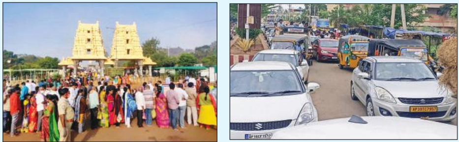
భక్తులకు వివిధమైన అసౌకర్యం కలగకుండా అన్ని విభాగాల ఏకవోలు, సూపర్ మార్కెట్లు, సినిమా, దర్శనం వర్కశేషించారు.

ద్వారకాతిరుమల, మేజర్ స్టూస్: శేషచల కొండపై పోటెత్తిన భక్తులు శనివారం స్వామివారికి ప్రీతికరమైన రోజు కావడంతో వేసవి సెలవులు ముగియుతుండటంతో విద్యార్థులు, తెలుగు దేశం పార్టీ, జనసేన పార్టీ, బిజెపి పార్టీ, కార్యకర్తలు, నాయకులు, భారీగా వివిధ ప్రాంతాల నుంచి శుక్రవారం రాత్రి కాలినడకన వచ్చి స్వామివారి ఆలయ ప్రాంతాల్లో నిద్రించి వేకువ జామునే కేసుఖండన శాల వద్ద తలనిలాలాను సమర్పించుకుని భక్తులు స్వామివారిని దర్శించుకున్నారు. కంపౌండ్ లో దర్శనం కూర్చుంటు, ప్రసాదాల కూర్చుంటు, భక్తులతో కిక్కిరించాయి. స్వామి వారి దర్శనం అనంతరం శ్రీ వకులు మాతా నిత్యా అనురాగ వధకములో స్వామివారి అన్నప్రసాదాన్ని స్వీకరించారు.