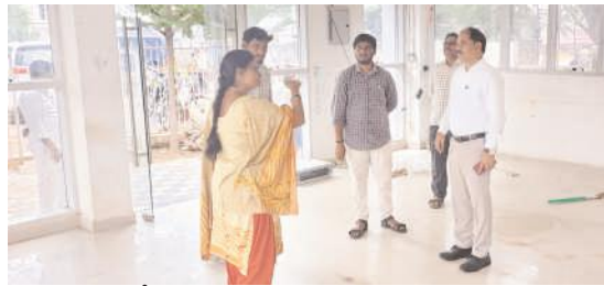
అన్న క్యాంటీన్ పునరుద్ధరణ పనులు పరిశీలిస్తున్న మున్సిపల్ కమిషనర్

ఎమ్మిగనూరు టౌన్, మేజర్ న్యూస్ : నిరుపేదలకు తక్కువ ఖర్చుతో భోజనం అందించే అన్న క్యాంటీన్లకు పూర్వ వైభవం రానుంది. కూటమి అధికారంలోకి వచ్చిన తర్వాత వీటి పునరుద్ధరణపై ముఖ్యమంత్రి చంద్రబాబు నాయుడు చేయడంతో గతంలో నిర్వహించిన భవనాల్లోని తిరిగి వీటిని ఏర్పాటు చేసేందుకు సన్నాహాలు చేస్తున్నారు. గత ప్రభుత్వ హయాంలో క్యాంటీన్ భవనాలను సచివాలయాలగా వినియోగించడంతో తిరిగి వీటి స్వరూపం తీసుకు వచ్చినందుకు చర్యలు ప్రారంభించారు. రూ. 5కే భోజనం, అల్పాహారం లభించే రోజులు అతి దగ్గరలోనే ఉన్నాయి. అన్న క్యాంటీన్ పునరుద్ధరణకు ప్రభుత్వం చర్యలు చేపట్టడంతో పేదలు హర్షాతిరేకాలు వ్యక్తం చేస్తున్నారు. గతంలో ఎమ్మిగనూరు పట్టణంలోని ప్రధాన రహదారి సోపపు సర్కిల్, శ్రీనివాస్ థియేటర్ ఎదురుగా రెండు అన్న క్యాంటీన్లను ఏర్పాటు చేశారు. క్యాంటీన్లకు మంచి స్పందన కూడా వచ్చింది. అయితే గత ప్రభుత్వం అధికారంలోకి వచ్చిన తర్వాత ఈ కేంద్రాలను మూసివేశారు. ఈ భవనాలను సచివాలయ కార్యాలయాలగా మార్చు చేశారు. ఇప్పుడు కూటమి