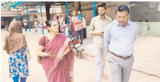
హాస్పిటల్లో పరీక్షిస్తున్న డి.ఎం.ఎస్. హెచ్.ఐ.

అక్షగడ్డ, మేజర్ న్యూస్ : మండలంలోని యస్. లింగంపల్లె గ్రామంలో గత సోమవారం పురుగుమందు ప్రభావంతో 20 మందికి పైగా కూలీలు అస్వస్థతకు గురై కొందరు నంద్యాల ఆసుపత్రిలో, కొందరు అక్షగడ్డ ప్రభుత్వ ఆసుపత్రిలో చికిత్స పొందుతున్నారు. ఇందుకు సంబంధించి నంద్యాల జిల్లా వైద్య ఆరోగ్యశాఖ అధికారి