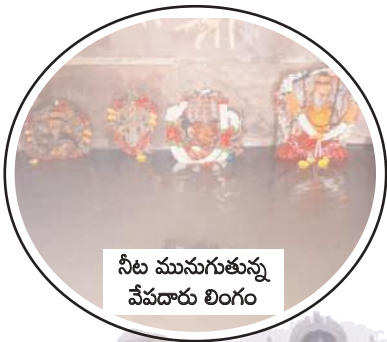
నీట మునుగుతున్న వేపదారు లింగం