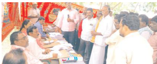
ఉపాధి అక్రమాలపై ఫిర్యాదు చేస్తున్న గ్రామ ప్రజలు