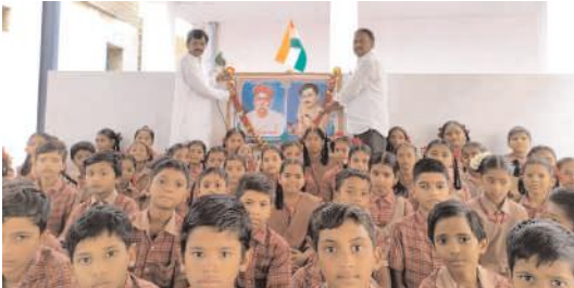
చిత్రపటాలకు పూలమాలవేసి నివాళులర్పిస్తున్న స్వచ్ఛంద ఆళ్లగడ్డ, మేజర్ న్యూస్ : ఆళ్లగడ్డ పట్టణంలోని కెవి సుబ్బారెడ్డి పాఠశాలలో స్వాతంత్రోద్యమ నాయకుల జయంతి ఉత్సవాలు ఘనంగా