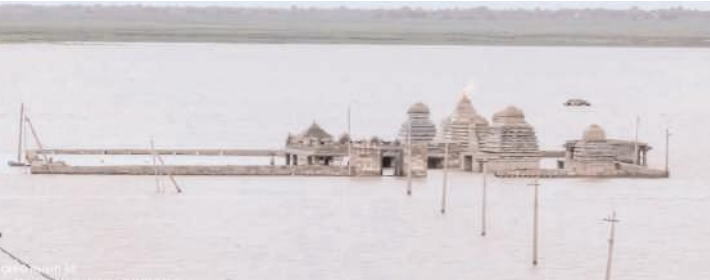
ఆలయం చుట్టూ చేరిన వరదనీరు