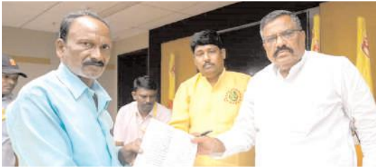
వినతులు స్వీకరిస్తున్న కోట్లసూర్యప్రకాష్ రెడ్డి

కర్నూలు, మేజర్ న్యూస్ ప్రతినిధి: ఆంధ్రప్రదేశ్ రాష్ట్ర ముఖ్యమంత్రి నారా చంద్రబాబునాయుడు ఆదేశాల మేరకు మంగళవారం మంగళగిరి తెలుగుదేశం పార్టీ కేంద్ర కార్యాలయంలో తెలుగుదేశం