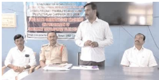
ఎంపిపిని పక్కకు కూర్చోబెట్టిన మత్స్యశాఖ అధికారులు