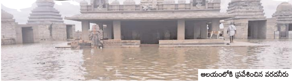
ఆలయంలోకి ప్రవేశించిన వరదనీరు

సంగమేశ్వరం ఆలయంలోకి ప్రవేశించిన కృష్ణా జలాలు