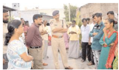
గుండమ్మ కుటుంబాన్ని పరామర్శిస్తున్న సబ్ కలెక్టర్, డీఎస్పీ

- శాంతిభద్రతల విఘాతం కలిగించే ఎంతటి వారినైనా ఊపేక్షించేది లేదు - సబ్ కలెక్టర్, డీఎస్పీ