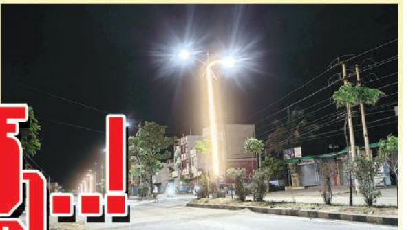
అక్కడక్కడ వెలుగుతున్న రోప్ లైట్స్

ఎమ్మిగనూరు, మేజర్ న్యూస్: ఎమ్మిగనూరు పురపాలక సంఘం పరిధిలోని రెండు బైపాస్ రోడ్లలో ఉన్న సెంట్రల్ లైటింగ్ స్తంభాలకు 'లైట్ రోప్ లైట్స్'ను చుట్టించి ఆ రోడ్లను జిగీల్ మసలా తయారు చేయించారు ఆ.అధికారి. ఇందు కోసం రూ.10లక్షలు వెచ్చించారు. అప్పట్లో కొత్తగా ఎమ్మిగనూరుకు వచ్చిన ఆ...అధికారి అప్పటి ఎమ్మెల్యే చెన్నకేశవరెడ్డి మెప్పు కోసం అనేక 'చోపుటవ'లు చేయగా అందులో రోప్ లైట్స్ కూడా ఒకటి. గతంలో అన్నమయ్య సర్కిల్ నుండి మార్కెట్ యార్డ్ వరకు, అలాగే పట్టణ ప్రధాన రహదారుల్లోని సెంట్రల్ లైటింగ్ స్తంభాలకు రూ.5లక్షలు ఖర్చు చేసి రోప్ లైట్స్ వేయించారు. అవి పట్టుమని రెండు నెలలు తిరక్క ముందే అన్నీ అటకెక్కాయి. సంవత్సరం పాటు కాంట్రాక్టర్ వాటి నిర్వాహణను చూసుకోవాలని టెండర్లలో నిబంధన ఉన్నా ఆ కాంట్రాక్టర్ తో మిలాఖత్ పట్ల వాటిని తిరిగి మరమ్మత్తు చేయించలేక మసిపూసి మారడకాయ చేశారు. ఇక జూన్ 4వ తేదీ ఎమ్మెల్యేగా గెలుపొందిన డాక్టర్ బీ.వి.జయనాగేశ్వరరెడ్డిని ప్రసన్నం చేసుకునేందుకు గాను ఆఫీసుపూలపై అన్నమయ్య సర్కిల్ నుండి శివ సర్కిల్ వరకు మరో రూ.5లక్షలు