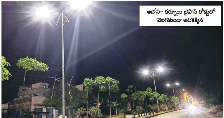
ఆదోని- కర్నూలు బైపాస్ రోడ్లలో వెలగకుండా అటకెక్కిన

పూయించి ఉంటే ఎంతో ఉపయోగకరంగా ఉండేది. లైట్స్ కొనుగోలులోనూ నిధుల దుర్వినియోగం చోటు చేసుకున్నట్లు ఆరోపణలు ఎనిపిస్తున్నాయి. బహిరంగ మార్కెట్లో రంగురంగుల 'లైట్ రోప్ లైట్స్' మీటర్ ధర రిటైల్లో రూ.90 నుండి రూ.100లోపు వలకుతుంది. అదే హోల్ సెల్ గా ఎక్కువ మీటర్లు కొనుగోలు చేస్తే రూ.80ల ధాక ధర ఉంటుంది. అయితే పురపాలక సంఘం అధికారులు కమిషన్ల కోసం కాంట్రాక్టర్ కానీ ఓ ఎలక్ట్రికల్ దుకాణం యజమానికి ఇద్దరు కాంట్రాక్టర్లను పరిచయం చేసి వారి పేర్లపై అసలు, డమ్మి టెండర్లను ఎలక్ట్రికల్ దుకాణం యజమానితోనే వేయించారు. దీంతో ఆ దుకాణ యజమాని అధిక ధరకు టెండర్ ను కోట్ చేసి దక్కించుకున్నారు. మార్కెట్లో మీటర్ రోప్ లైట్ ధర రూ.100లోపే ఉన్నా అధికారుల అండదండలతో మీటర్ రోప్ లైట్ కు రూ.140 ధరను దుకాణ యజమాని కోట్ చేశారు. అధికారుల ధనదాహం కారణంగా మీటర్ కు రూ.50లు పైనే పురపాలక సంఘం నష్టపోవాల్సి వచ్చింది. ఇప్పటికైనా ఉన్నతాధికారులు ఈ అవినీతిపై చర్యలు తీసుకోవడంతో పాటు నిర్వహణలో భాగంగా కాంట్రాక్టర్ చేత తిరిగి రోప్ లైట్స్ వెలిగిలా చర్యలు తీసుకోవాలని పుర ప్రజలు కోరుతున్నారు. ఏఈ వివరణ: ఆదోని- కర్నూలు రహదారిలో అటకెక్కిన రోప్ లైట్స్ పై మున్సిపల్ ఏఈ శరత్ ను వివరణ కోరగా రూ.4.50లక్షలతో వేయించిన రోప్ లైట్స్ వర్షాల పట్ల కొన్ని దెబ్బతిన్న మాట వాస్తవమేనన్నారు. ఏడాది పాటు కాంట్రాక్టర్ నిర్వహణ చేయాల్సి ఉండటంతో వాటిని మరమ్మత్తు చేయించి తిరిగి వెలిగిలా చర్యలు తీసుకుంటామని ఆయన తెలిపారు.