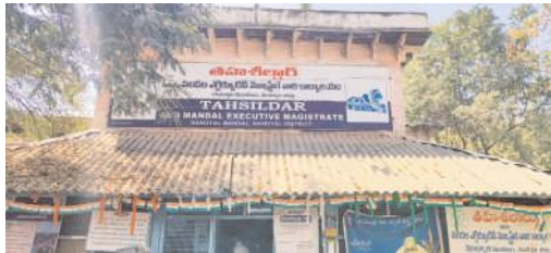
నంద్యాల తహశీల్దార్ కార్యాలయం