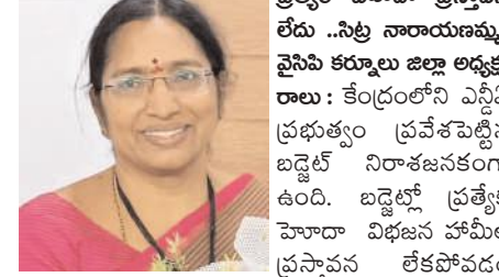
నైసిపి కర్నూలు జిల్లా అధ్యక్షురాలు