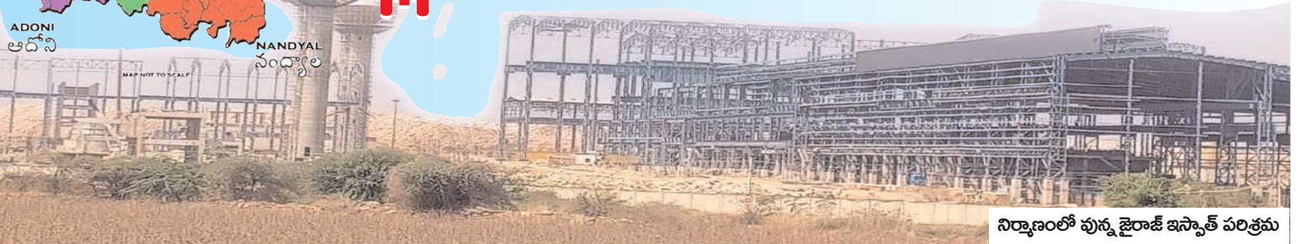
నిర్మాణంలో వున్న జైరాజ్ ఇస్పాత్ పరిశ్రమ