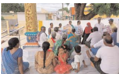
అవగాహన కల్పిస్తున్న వైద్యాధికారి