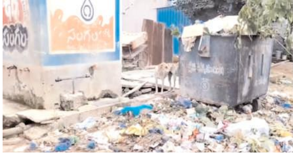
పట్టణంలో కూరుకపోయిన చెత్త

అధికారులకు చెప్పినా కంటితుడుపు చర్యలతో చేతులు దులుపుకున్నారంటూ ప్రజలు ఆగ్రహం వ్యక్తం చేస్తున్నారు. మురికికుంటలపై దోమలు విస్తరించడంతో వీకిటి పడతే చాలు కుదురుగా ఒక్కచోట నిలబడలేని పరిస్థితి, రాత్రుల్లో కంటిపై కునుకు కరువైందని ప్రజలు గగ్గోలు పెడుతున్నారు. పరిశుభ్రత పాటించండి సీజనల్ వ్యాధుల నుంచి రక్షించుకోండి అని డ్రెడే, ఫ్రెడే లాంటి