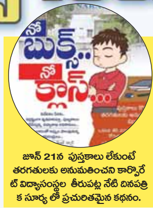
జూన్ 21న పుస్తకాలు లేకుంటే తరగతులకు అనుమతించని కార్పొరేట్ విద్యాసంస్థల తీరుపట్ల నేటి దినపత్రిక సూర్య లో ప్రచురించిన కథనం.

అనంతపురం విద్యా మేజర్ న్యూస్ : కరవు జిల్లా అయిన అనంతపురం జిల్లాలో విద్య పేరిట జరుగుతున్న దోపిడీకి తల్లిదండ్రులు విలవిల్లాడు తున్నారు. తమ పిల్లలకు మంచి విద్యను అందించాలన్న సంకల్పమే వారి ఆర్థిక పరిస్థితిని అడ్డోగతి పాలు చేస్తోంది. అయితే.. విద్య హక్కు చట్టం ప్రకారం ప్రైవేట్, కార్పొరేట్ విద్యాసంస్థలు వ్యవహారిస్తే విద్యార్థుల తల్లిదండ్రులకు ఇలాంటి దుస్థితి ఉండదు. ఎందుకంటే... ఫీజులు చెల్లించేందుకు రెండు మూడు నాలుగు విడతల వారీగా అవకాశం ఉంటుంది. అలా కాకుండా ఒకటి లేదా రెండు విడతల్లో పూర్తి ఫీజు చెల్లించాలని హుకుం జారీ చేయడం.. విద్యా సంవత్సరం ప్రారంభమైన వెంటనే సగానికి పైగా ఫీజు చెల్లించాలని ఒక్కడి చేయడం వల్ల విద్యార్థుల తల్లిదండ్రులు తీవ్ర ఆర్థిక ఇబ్బందులకు గురవుతున్నారు. ఇక మరో విషయం ప్రైవేట్ కార్పొరేట్ సంస్థలే తమ సంస్థ పేరిట ముద్రించిన పుస్తకాలను విక్రయించడం. ఈ విధంగా పాఠశాల తెరిచిన వెంటనే వేలకు వేలు పెట్టి ఫీజులు చెల్లించాలని డిమాండ్ చేయడం విద్యార్థులు తల్లిదండ్రులకు తీవ్ర ఇబ్బందులు తీసుకొస్తోంది. గతంలో మాదిరి బుక్ స్టాల్స్ లో పుస్తకాలు కొనుక్కునే విధంగా చర్యలు ఉంటే తమ ఆర్థిక పరిస్థితులకు అనుకూలంగా