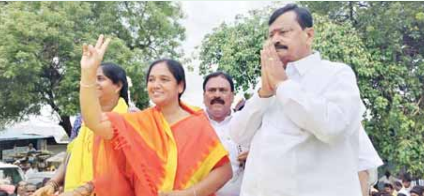
విజయంలో రాష్ట్ర ఎమ్మెల్యే పరిటాల సునీత కీలక భూమిక తీసుకొచ్చేందుకు శక్తి వంపన లేకుండా పని ఉందన్నారు. ఈ ప్రాంతానికి కేంద్రం నుంచి నిధులు చేస్తానన్నారు.