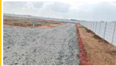
సర్వే నెంబర్ 14 (2)లో అనధికారికంగా ఏర్పాటు చేసిన కాంపౌండ్ వాల్.. లోపల రోడ్డు..