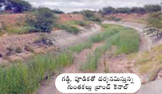
గడ్డి, పూడికతో దర్శనమిస్తున్న గుంతకల్లు బ్రాంచ్ కెనాల్