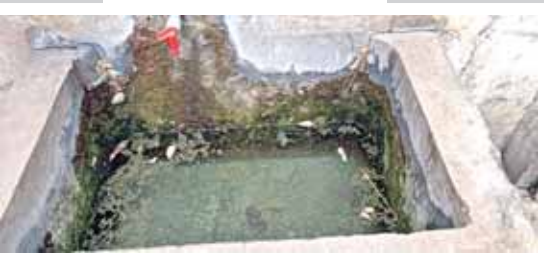
నగరంలోని సాంఘిక సంక్షేమ హస్తల్ నెం.4లో వాచిపట్టిన తొట్టలో నిల్వ ఉన్న నీరు