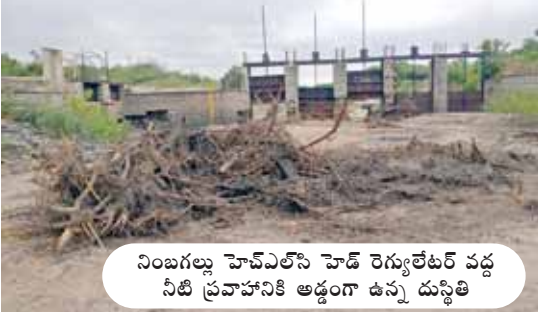
నిబంధనలు హెచ్ఎల్సీ హెడ్ రెగ్యులేటర్ వద్ద నీటి ప్రవాహానికి అడ్డంగా ఉన్న దుస్థితి