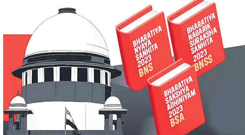
ఆడియో, వీడియో సాక్ష్యాలను జాతీయ స్థాయిలో ఏర్పాటు చేసిన డిజి లాకర్ భద్రపరుస్తారు. పెళ్లి చేసుకుంటానని చెప్పి తప్పుడు వాగ్మూలాలతో సంబంధాలు పెట్టుకునే వారిపై కొత్త చట్టాల్లో కఠిన శిక్షలు ఉన్నాయి.

మహిళా భద్రతకు పెద్దపీట కొత్త నేర, న్యాయ చట్టాల ప్రకారం.. క్రిమినల్ కేసుల్లో విచారణ పూర్తయిన 45 రోజుల్లోగా తీర్పు ఇవ్వాలి. మొదటి విచారణ నుంచి 60 రోజులలోపే అభియోగాలను నమోదు చేయాలి. 3 నుంచి 7 ఏళ్లలోపు శిక్ష వదల కేసుల్లో ఫిర్యాదు అందిన 24 గంటల్లోనే ఎఫ్ఐఆర్ నమోదు చేయాలి. 14 రోజుల్లోనే ఈ కేసును కొలిక్కి తెచ్చాలి. అత్యాచార బాధితుల వాంగ్మూలాన్ని సంరక్షకుల సమక్షంలో మహిళా పోలీసు అధికారి నమోదు చేయాల్సి ఉంటుంది. ఆ బాధితురాలి వైద్య నివేదికలు ఏడు రోజుల్లోనే సిద్ధం చేయాలి. మహిళలు, చిన్నారులపై జరిగే నేరాలలో దర్యాప్తును రెండు నెలల్లోనే పూర్తి చేయాలి. బాధితుల వాంగ్మూలాన్ని మహిళా మెజిస్ట్రేట్ ముందు నమోదు చేయాలి. వాళ్లు లేకుంటే మహిళా సిబ్బంది ఎవరైనా పురుష మెజిస్ట్రేట్ ముందు హాజరుపర్చాలి. అత్యాచార కేసుల్లో బాధితురాలి వాంగ్మూలాన్ని ఆడియో, వీడియోల ద్వారా సేకరించి పోలీసులు కేసు నమోదు చేయాలి. అయితే పోక్సో కేసుల్లో బాధితురాలి వాంగ్మూలాలు పోలీసులే కాకుండా మహిళా ప్రభుత్వ అధికారి ఎవరైనా నమోదు చేయొచ్చు. క్రిమినల్ కేసుల విచారణలో అలస్యాన్ని నివారించడానికి న్యాయస్థానాలు గరిష్టంగా కేవలం రెండు వాయిదాలు మాత్రమే మంజూరు చేయాల్సి ఉంటుంది. సాక్షుల వాంగ్మూలాలు,