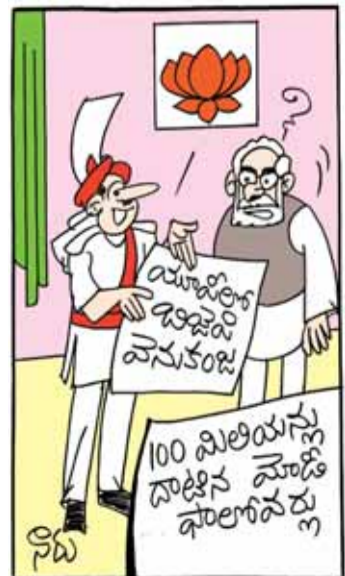
మనకు ఓటర్లు తగ్గారు, కానీ ఫాలోవర్లు పెరిగారు సార్