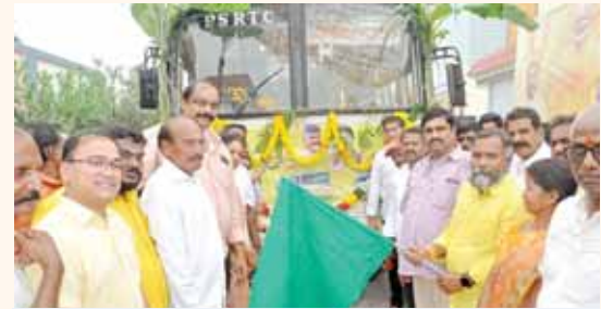
కాణిపాకం టు బంగారుపాళ్ళం ఆర్టీసీ బస్సు ప్రారంభిస్తున్న పూతలపట్టు ఎమ్మెల్యే కలికిరి

-కాణిపాకం టు బంగారుపాళ్ళం ఆర్టీసీ బస్సు ప్రారంభించిన పూతలపట్టు ఎమ్మెల్యే కలికిరి - స్వయంగా బస్సు నడిపిన పూతలపట్టు ఎమ్మెల్యే