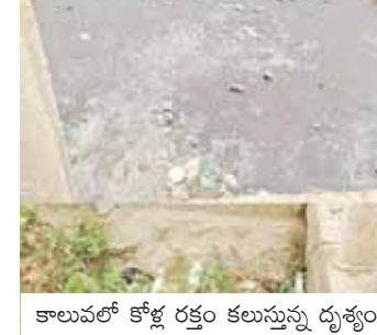
కాలవలో కోళ్ళ రక్తం కలుస్తున్న దృశ్యం

ఏ రోజుకు ఆ రోజు చేపలు పట్టుకొని అమ్ముకుంటే కానీ జీవనం సాగని వాళ్ళకి శుభ్రత మీద అవగాహన చేయకపోగా, ఏకంగా పంచాయతీ వాళ్ళు చేపలును తీసే యడం ఎంత వరకు సబబు అని ప్రశ్నిస్తున్నారు. న్యాయం అందరికీ సమానమే కదా! అంటూ, ఇకనైనా ప్రత్యామ్నాయ మార్గం చూపెందుకు, సంబంధిత అధికారులు చొరవ చూపి, కాలవలో మురుగును తొలగించేందుకు చర్యలు చేపట్టాలని, తద్వారా ప్రజలు రోగాల బారిన పడకుండా కాపాడాలని స్థానికులు కోరుకుంటున్నారు.