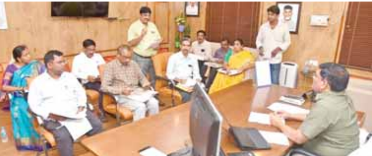
ప్రజల నుంచి అందే వినతులను సత్వరమే పరిష్కరించాలని అధికారులకు దిశ నిర్దేశం చేస్తున్న జాయింట్ కలెక్టర్ శ్రీనివాసులు

97 వినతులకు సంబంధించి తగు నివేదికను ఈ నెల 16 ఉదయం లోపు పంపాలని, అదే రోజు సాయంత్రం 4 గంటకు ఈ అంశం పై సమీక్ష ఉంటుందని, సహాయనిధి కొరకు అందిన వినతులలో చేయదగిన వాటికి నివేదిక ఇచ్చి చేయలేని వాటికి తగిన ఎండార్నెంట్ ను తగు విధి విధానాలను సూచిస్తూ అర్జీదారునికి పంపాలన్నారు. సంబంధిత నివేదికను వెబ్ సైటు నందు అప్ లోడ్ చేయాలన్నారు. కుప్పంలో ముఖ్యమంత్రికి అందిన వినతుల పరిష్కారంపై కూడా చర్యలు చేపట్టాలని తెలిపారు. జనన మరణ, కుల ధృవీకరణ పత్రాల మంజూరుకు సంబంధించి ఇప్పటికే పెం డెస్సి ఎక్కువగా ఉన్నదని, పెం డెస్సిని తగ్గించాలని, దరఖాస్తుదారులు వారు ఇచ్చిన చిరునామాతో క్షేత్ర స్థాయిలో వివరాలను సరిచూసుకుని సంబంధిత విఆర్.ఓ ల నివేదికతో తహశీల్దారులు ధృవీకరణ పత్రాలను త్వరితగతిన మంజూరు చేయాలని, ఆన్ లైన్ లో ధృవీకరణ పత్రాలను మంజూరు చేయాలన్నారు. ఏపీసేవా ద్వారా అందించే రెవెన్యూ సేవలలో 671 బియాండ్ ఎస్ఎల్ఎ లో కలవని, తవణంపల్లి మండలంలో ఎక్కువగా కలవని, వీటిని వెంటనే పరిష్కరించాలని తెలిపారు. పౌర సరఫరాల శాఖ ద్వారా ప్రజా పంపిణీ వ్యవస్థలో అందించే వస్తువుల పంపిణీ ప్రతి నెల 15 వ తేదీ కల్లా పూర్తి కావాలని, జిల్లాలో ఖాళీగా ఉన్న చౌక దుకాణాల డిల్లర్ వివరాలను సమర్పించాలని, డిఎన్ఓ ను ఆదేశించారు. ప్రతి మండలంలో జరుగుతున్న ప్రజా పంపిణీ వ్యవస్థను తహశీల్దారుల పర్యవేక్షిస్తూ క్షేత్ర స్థాయిలో డి.టి, సీనియర్ జూనియర్ అసిస్టెంట్ పరిశీలించాలని తెలిపారు. ఈ వీడియో కాన్ఫరెన్స్ కు డిఆర్.ఓ బి.పుల్లయ్య, స్పెషల్ డిప్యూటీ కలెక్టర్ భవానీ, డిఎన్ఓ శంకరన్, డి ఎల్ డి ఓ రవి కుమార్, ఎ.డి సర్వే గౌస్ ఖామ, ట్రాన్స్మి ఇ.ఇ హరి, తదితరులు పాల్గొన్నారు.