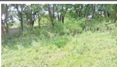
ప్రాథమిక ఆరోగ్య కేంద్రం ఆవరణలో పెరిగిపోయిన మొక్కలు

వెదురుకుప్పం, మేజర్ స్వామి: పచ్చికావలం ప్రాథమిక ఆరోగ్య కేంద్రం ఆవరణలో పిచ్చి మొక్కలు వేపుగా పెరిగిపోవడంతో రోగులకు ఇబ్బంది కరంగా ఉందని పలువురు తెలియజేశారు. పిచ్చి మొక్కల కారణంగా పాములకు నిలయంగా తయారైంది. ప్రాథమిక ఆరోగ్య కేంద్రంనకు ప్రతిరోజూ 100 నుండి 200 వరకు రోగులు వస్తుంటారు. రాతు లందు అత్యవసర చికిత్సలకు ఆరోగ్య కేంద్రానికి రావడం పరిపాటి. ఆరోగ్య కేంద్రం ఆవరణలో చెట్లు పెరిగిపోవడంతో రోగులు భయభ్రాంతులకు గురవుతున్నట్లు పలువురు వాపోతున్నారు. పిచ్చి మొక్కలను