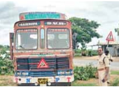
ఏర్పేడు ప్రమాదం జరిగిన ప్రాంతాన్ని పరిశీలిస్తున్న రవాణా శాఖ అధికారులు

శ్రీకాళహస్తి, మేజర్ న్యూస్ : ఆంధ్ర ప్రదేశ్ రవాణా శాఖా మంత్రి రాంప్రసాద్ రెడ్డి ఏర్పేడు పోలీస్ స్టేషన్ పరిధిలో జరిగిన రహదారి ప్రమాదం గురించి రీజనల్ జిటిసీ బిసి రెడ్డి ద్వారా వివరాలు తెలుసుకొని, ప్రమాదం జరిగిన ప్రదేశాన్ని సందర్శించి ప్రమాదం జరగడానికి గల కారణాలను తెలపాలని ఆదేశించారు. మంత్రి