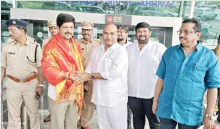
తిరుపతి ఎడ్యుకేషన్, మేజర్ న్యూస్: