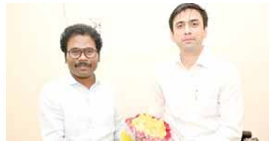
జిల్లా కలెక్టర్ కు పుష్పగుచ్ఛం అందిస్తున్న ఎమ్మెల్యే

వినిపిస్తున్నాయి. రాష్ట్రంలో వైసిపి ప్రభుత్వం పతనమై తెలుగుదేశం ప్రభుత్వం అధికారాన్ని చేపట్టడంతో చవట గుంట సింగిల్ విండోపై గంగాధర నెల్లూరు ఎమ్మెల్యే డాక్టర్ విఎం థామస్ దృష్టి పెట్టాల్సిన అవసరం ఎంతైనా ఉంది. ఒకే చోట తిష్ట వేసిన ఉద్యోగులను బదిలీలు చేసి సింగిల్ విండోలో ప్రక్షాళన చేయవలసిన అవసరం ఉందని పలువురు అంటున్నారు. ఎమ్మెల్యే సింగిల్ విండోలపై ప్రత్యేకచొరవ తీసుకుని ఉద్యోగులను బదిలీలు చేసి, సింగిల్ విండోలను బలోపేతం చేయాలని పలువురు విజ్ఞప్తి చేస్తున్నారు.