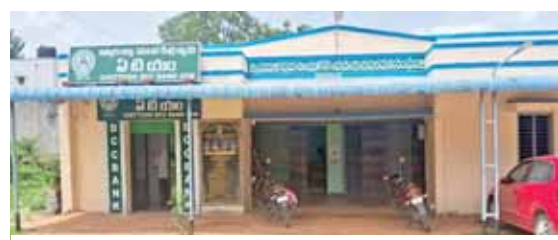
చవట గుంట సింగిల్ విండో ఇడో

వెదురుకుప్పం, మేజర్ న్యూస్: సుమారు 15 సంవత్సరాలు బదిలీలు లేకుండా ఒకే చోట తిష్ట వేస్తున్న ఉద్యోగుల తతంగం వెదురుకుప్పం మండలం చవటకుంట సింగిల్ విండోలో చోటు చేసుకుంది. స్థానికుల కథనం మేరకు చవట గుంట సింగిల్ విండోలో పనిచేస్తున్న సిబ్బంది కాంగ్రెస్, వైసిపి ప్రభుత్వాలలో బదిలీలు లేకుండా ఒకే చోట ఉద్యోగం చేస్తున్నారు. దీంతో సొసైటీలో అక్రమాలకు అవకాశాలు ఉన్నట్లు పలువురు అనుమానాలు వ్యక్తం చేస్తున్నారు. ఏ ప్రభుత్వం వచ్చిన తమను ఏమీ చేయలేదన్న ధీమాతో సిబ్బంది ఉన్నట్లు పలువురు విమర్శిస్తున్నారు. బదిలీలు లేకుండా ఒకే చోట ఉద్యోగం చేస్తుండడంతో రైతులను ప్రలోభాలకు గురి చేస్తున్నట్లు పలువురు విమర్శిస్తున్నారు. సింగిల్ విండో అధ్యక్షులు పదవీకాలం ముగిసిపోయినప్పటికీ వైసిపి అధికారంలో ఉండడంతో అధ్యక్షులను మార్పు చేయకుండా ఆరు నెలలకు ఒక మారు పొడిగిస్తూ వచ్చారు. దీంతో సింగిల్ విండోలో పనిచేస్తున్న సిబ్బంది తమ చేతివాటాన్ని ప్రదర్శిస్తున్నారు అన్న వాదనలు మెండుగా