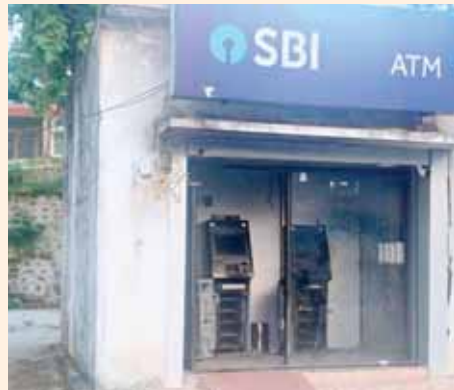
చోరీకి గురి అయిన ఏటీఎం

- సుమారు రూ.25 లక్షలు ఎత్తుకెళ్లిన దుండగులు - గ్యాస్ కట్టర్ తో ఏటీఎం మిషన్ కట్టింగ్ - పక్కా ప్లాన్ ప్రకారం చోరీ - సెక్యూరిటీ లేకపోవడంతోనే ఘటన - ఘటనాపై ఎస్పీ సీరియస్