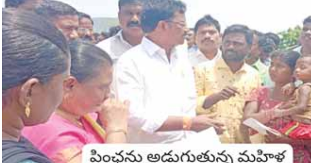
పంచను అడుగుతున్న మహిళ

ఎమ్మెల్యే దృష్టికి తీసుకెళ్లారు. దీనిపై స్థానిక తహశీల్దార్ ఉదయ భారతి, ఆర్ఐఐ వేణుగోపాల్, విఆర్ఓ నాగేంద్రకు ఎమ్మెల్యే పలు సూచనలు ఇస్తూ, భూమి కొనుగోలు చేయడం జరిగిందని, అందులో సుమారుగా 350 మందికి పైగా జాబితా తయారుగా ఉందని, వీలైనంత త్వరగా జిల్లా అధికారులు అనుమతితో స్థలాలు ఇచ్చేందుకు చర్యలు చేపడుతామని ఎమ్మెల్యే అన్నారు. వీధుల పరిస్థితి స్వయంగా ఎమ్మెల్యే చూశారు. విద్యుత్ శాఖ, రెవెన్యూ, ఎంపీడీఓ, కార్యాలయం అధికారులు, కూటమి నాయకులు, పత్రికా విలేకరులు ఈ కార్యక్రమంలో పాల్గొన్నారు.