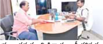
ప్రజల వద్ద నుంచి ఫిర్యాదులు స్వీకరిస్తున్న జిల్లా ఎస్సీ మణికంఠ చందోలు

చిత్తూరు అర్బన్, మేజర్ న్యూస్: ప్రజా ఫిర్యాదుల పరిష్కారం కార్యక్రమానికి వచ్చిన ఫిర్యాదులన్నింటిపై చట్ట ప్రకారం విచారణ జరిపి, నిర్దేశించిన గడువులోగా ఫిర్యాదు దారుల సమస్యలను త్వరితగతిన పరిష్కరించాలని సంబంధిత పోలీసు అధికారులను జిల్లా ఎస్సీ వి.ఎస్.మణికంఠ చందోలు ఆదేశించారు. జిల్లా నలుమూలల నుంచి వచ్చిన ప్రజలు నేరుగా ఎస్సీని, ఆడిషనల్ ఎస్సీ అడ్మిన్ ఆరిఫుల్లాని, దిశా డిఎస్సీ సుధాకర్ రెడ్డిని కలిసి తమ సమస్యలను విన్నవించుకున్నారు. ఈ ఫిర్యాదులకు స్పందిస్తూ త్వరిత గతిన విచారణ జరిపి ఫిర్యాదు దారులకి న్యాయం చేయాలని సంబంధిత అధికారులకు ఆదేశించారు.