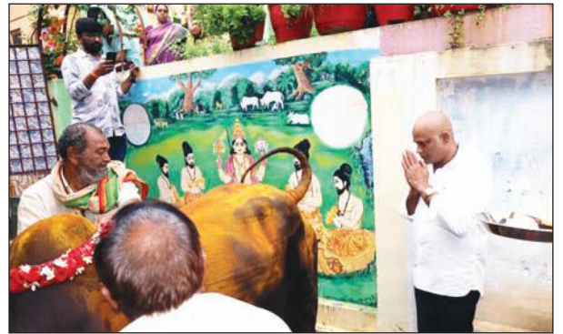
తిరుమల తిరుపతి దేవస్థానంకు గోదానం

క్షణ కార్యదర్శిగా విధుల్లోకి తీసుకున్నారు మరల వీరిని పోలీస్ డిపార్ట్మెంట్లో విలీనం చేస్తున్నామని చెప్పారు. కానీ వీరిలో వయసు రిట్యా ఆరోగ్యరిత్యా మే ము హామ్ డిపార్ట్మెంట్లో విధులు నిర్వహించలేమని చెప్పిన శశి మేరా మీరు ని ర్వహించవలసినదేనని చెప్పి ఉన్నారు. గత ప్రభుత్వంలో గ్రామ వార్డు సచివాల య ఉద్యోగుల సమస్యలన్నీ కూడా అపరిస్పృతంగానే మిగిలిపోయినవి. ఆం ద్రప్రదేశ్ రాష్ట్ర ముఖ్యమంత్రిగా ప్రమాణస్వీకారం చేసిన నారా చంద్రబాబు నాయుడు సారథ్యంలో గ్రామ వార్డు సచివాలయ ఉద్యోగుల సమస్యలన్నీ కూ డా పరిష్కారం అవుతాయని ఆశాభావంతో ఉన్నాము. ఐటీ, కమ్యూనికేషన్ ఇం డస్ట్రీస్ మంత్రిగా పదవి బాధ్యతలు చేపట్టిన నారా లోకేశ్ కి గ్రామ వార్డు సచి వాలయ ఉద్యోగులు అందరి తరపున శుభాకాంక్షలు తెలిపారు. రాష్ట్ర ప్రధాన కార్యదర్శి రామ అజయ్ కుమార్ మాట్లాడుతూ ఆంధ్రప్రదేశ్ రాష్ట్ర ముఖ్య మంత్రి నారా చంద్రబాబునాయుడు చేతుల మీదుగా ప్రతిష్టాత్మకంగా నిర్వహిం చబోతున్న పెన్షన్ కార్యక్రమాన్ని విజయవంతం చేయవలసిందిగా గ్రామ వార్డు సచివాలయ ఉద్యోగులందరినీ కోరారు. ఈ కార్యక్రమంలో రాష్ట్ర కోశాధికారి బి.పాండురంగ, రాష్ట్ర వర్మింగ్ ప్రెసిడెంట్ ఎం. రాజేష్, రాష్ట్ర ఆర్గనైజింగ్ సెక్రటరీ సుధర్శన్ రాజ్, జాయింట్ సెక్రటరీ శశికళ తదితరులు పాల్గొన్నారు.