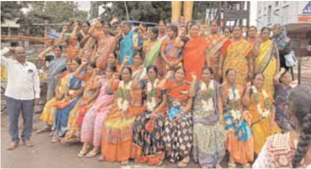
కర్నూల్ ఘాట్, మేజర్ న్యూస్ : మధ్యాహ్న భోజనం పథకాన్ని అక్షయపాత్ర సంస్థచే సంస్థకు, ఇవ్వద్దని హయత్ నగర్, అబ్దుల్లాపూర్ మెట్టు మండలాల

▶▶ స్వచ్ఛంద సంస్థ అక్షయపాత్రకు అంటగడితే ఊరుకునేది లేదు ▶▶ 23 సంవత్సరాలుగా సేవలందిస్తున్న మమ్మల్ని గుర్తించండి ▶▶ ప్రభుత్వ తీరు మారకుంటే మరో ఉద్యమం తప్పదు ▶▶ సీనిటీయూ రంగారెడ్డి జిల్లా నాయకులు ఏర్పలు నరసింహ