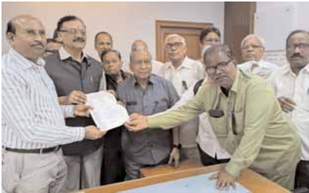
సిటీబ్యూరో,మేజర్న్యూస్: తెలంగాణ రాష్ట్ర వ్యాప్తంగా ఉన్న 2.8లక్షల మంది పెన్షనర్ల బాగాగులు,సమస్యలను పరిష్కరించేందుకు తగిన రాష్ట్ర ప్రభుత్వం తగిన