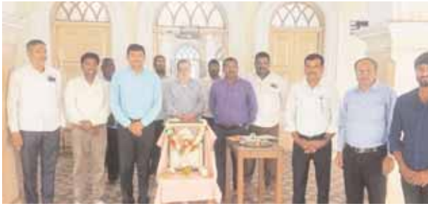
హిమాయత్ నగర్, మేజర్ న్యూస్ : భారత మాజీ ఉప ప్రధాని బాబు జగ్జీవన్ రామ్ వర్ధంతి కార్యక్రమాన్ని శనివారం నిజాం కళాశాలలో నిర్వహించారు.

నిజాం కళాశాలలో బాబు జగ్జీవన్ రామ్ కు నివాళులు