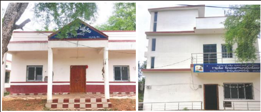
తెరుచుకొని రైతు భరోసా కేంద్రం

పుల్లంపేట, మేజర్ న్యూస్: అధికారులు మీ జాడ ఎక్కడ అని సచివాలయాలకు పనిమీద వచ్చే ప్రశ్నిస్తున్నారు. గత ప్రభుత్వంలో లక్షల రూపాయలు ఖర్చు చేసి గ్రామస్థాయిలో పెద్దపెద్ద భవనాలు నిర్మించి సచివాలయాల ఏర్పాటు అధికారులను నియమించారు. అయితే ప్రస్తుతం ఆ సచివాలయాలలో అధికారుల జాడ మాత్రం కనిపించడం లేదు. ప్రస్తుతం ఎన్నికలు ముగిసి ఉండడం, ఎన్నికల విధులలో భాగంగా అధికారులు మండలాలకు వచ్చి ఉండడం, వారు నేడో రేపు తిరిగి వెళ్లిపోయే అవకాశం ఉందని భావిస్తున్న సచివాలయ అధికారులు ఎవరికి ఇష్టం వచ్చినట్లు వారు ప్రవర్తిస్తున్నారు. పుల్లంపేట మండలంలో ఒకటి రెండు సచివాలయాలలో తప్ప ఎక్కడ అధికారుల హాజరు కనిపించడం లేదు. ఒకవేళ సచివాలయాల తలుపులు తెరుచుకున్న అందులో ఎవరో ఒకరు ఉంటారు తప్ప పూర్తిస్థాయి అధికారులు మాత్రం హాజరయ్యే పరిస్థితి కనిపించడం లేదు. ముఖ్యంగా కొమ్మనవారిపల్లి సచివాలయంలో అయితే 11 దాటిన ఎవరో ఒకరు అధికారి తప్ప మిగిలిన వారు అస్సలు కనిపించరు. ప్రజలు ఏదైనా పనిమీద వస్తే మాత్రం మండల కేంద్రంలో ఉంటారు, లేదా ఫీల్డ్ పై ఉంటారని కాకమ్మ కథలు చెప్పడం తప్ప ప్రజలకు మాత్రం అందుబాటులో ఉండడం లేదు. ఇలా ఒక్కరోజు కాదు ప్రతిరోజు ఇదే తరం. ఇదే విషయంపై స్థానిక నాయకులు కూడా సచివాలయాలను పరిశీలించి ఇక్కడ అధికారులు అందుబాటులో లేకపోవడం చూసి ఆశ్చర్యం వ్యక్తం చేసిన సంఘాలు కూడా చాలా ఉన్నాయి. మరి సచివాలయాలలో విధులు నిర్వహించవలసిన అధికారులు సచివాలయాలలో ఉండకుండా మరి ఎక్కడ పని చేస్తున్నారో అర్థం కావడం లేదని పలువురు ప్రశ్నిస్తున్నారు.