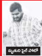
మృతుని ఫైల్ పోటో

- మరాకలికి తీవ్ర గాయాలు సూర్య కలీంగగర్ ప్రతినిధి కలీంగగర్ పట్టణంలో గల కోతి రాంపూర్ వద్ద శుక్రవారం తెల్లవారుజామున జరిగిన రోడ్డు ప్రమాదంలో ఒక వ్యక్తి దుర్మరణం చెందాడు. మరొక (మగతా 2లో)