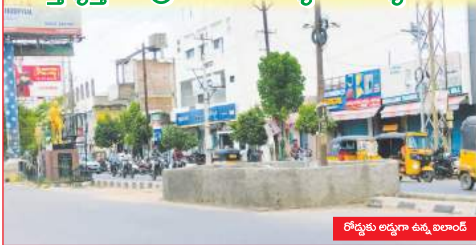
రోడ్డుకు అడ్డుగా ఉన్న ఐలాండ్