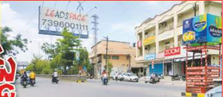
ప్రమాదాలు జరుగు యూటర్న్