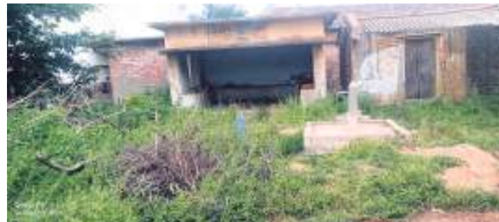
అధికారులు స్పందించిపిచ్చి మొక్కలను తొలగించి బస్ షెల్టర్ ను ఉపయోగంలోకి తీసుకురావాలని గ్రామ ప్రజలు కోరుతున్నారు.

గంభీరావుపేట మండలం నర్సాల గ్రామం మానేరు క్యాంపు వద్ద బస్ షెల్టర్ నిరుపయోగంగా మారింది. పిచ్చి మొక్కలతో నిండిపోయింది. దీంతో ప్రయాణికులు ఎండా వానలకు తీవ్ర ఇబ్బందులు పడుతున్నారు. కొన్ని ఏళ్ల కిందట నిర్మించిన బస్ షెల్టర్ యాచకులకు నివాసాలుగా అసాంఘిక కార్యకలాపాలకు నెలవలుగా మారింది. దీంతో ప్రజలు రాకపోకలు సాగించే సమయంలో దుకాణాలు రోడ్లపై వేచి ఉండాల్సిన పరిస్థితి నెలకొంది. ముఖ్యంగా వర్షాలు పడే సమయంలో వాహనాల కోసం ఎదురు చూసేందుకు ప్రయాణికులు తీవ్ర ఇబ్బందులు పడుతున్నారు. బస్ షెల్టర్ ప్రాంగణంలో పిచ్చి మొక్కలు ఏవుగా పెరిగాయి. అధికారులు స్పందించిపిచ్చి మొక్కలను తొలగించి బస్ షెల్టర్ ను ఉపయోగంలోకి తీసుకురావాలని గ్రామ ప్రజలు కోరుతున్నారు.