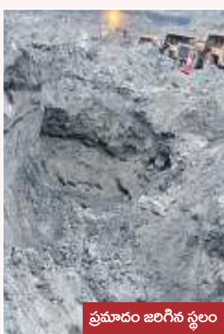
ప్రమాదం జరిగిన స్థలం