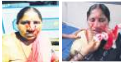
గాంధీనగర్ కు చెందిన