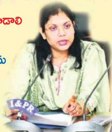
సూర్య కరీంనగర్ ప్రతినిధి

రైతు రుణమాఫీ అంశంలో బ్యాంకర్లు ప్రభుత్వ నిబంధనలు కచ్చితంగా పాటించాలని పమేలా సత్పతి ఆదేశించారు. గురువారం కరీంనగర్ కలెక్టర్ కాన్ఫరెన్స్ హాల్లో రైతు రుణమాఫీ అంశంపై బ్యాంకర్లతో జిల్లా కలెక్టర్ సమన్వయ సమావేశం నిర్వహించారు. ఈ సందర్భంగా రైతు రుణమాఫీకి సంబంధించిన అంశాలపై బ్యాంకర్లతో చర్చించారు. ఈ సందర్భంగా జిల్లా కలెక్టర్ మాట్లాడుతూ ప్రభుత్వం అత్యంత ప్రతిష్టాత్మకంగా రైతు రుణమాఫీ పథకాన్ని అమలు చేస్తున్నదని పేర్కొన్నారు. కరీంనగర్ జిల్లాలో 35,686 రైతు కుటుంబాలకు సంబంధించిన 37,745 బ్యాంకు ఖాతాల్లో ప్రభుత్వం 194.64 కోట్లు (మిగతా 2లో)