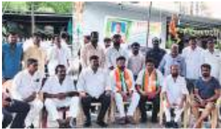
పోయారని, కార్మికుల ప్రమాదానికి సింగరేణి అధికారులు బాధ్యత వహించాలని వారిపైన వెంటనే హత్య నేరం కేసు నమోదు చేయాలని డిమాండ్ చేశారు. సింగరేణి వ్యాప్తంగా ఏదో