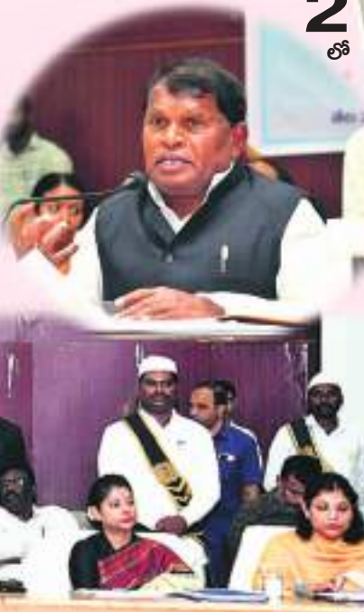
సూర్య కలీంగర్ ప్రతినిధి