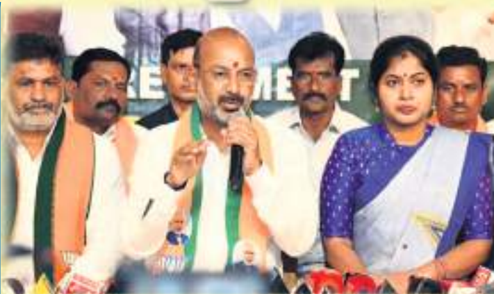
సూర్య ఉమ్మడి కరీంనగర్ జిల్లా ప్రతినిధి కేంద్రాన్ని బదనాం చేసేందుకే కేంద్ర బడ్జెట్ లో తెలంగాణకు అన్యాయం చేశారంటూ రాష్ట్ర ప్రభుత్వం అసెంబ్లీలో తీర్మానం చేశారని కేంద్ర హోం శాఖ సహాయ మంత్రి బండి సంజయ్ కుమార్ అన్నారు. శనివారం కరీంనగర్ లో ఏర్పాటు చేసిన మీడియా సమావేశంలో ఆయన మాట్లాడుతూ రాష్ట్ర బడ్జెట్ లో లక్షా 9 వేల కోట్ల నిధులు కేంద్రం నుండి వచ్చేవే...మరి తెలంగాణకు పైనా ఇవ్వలేదని సిగ్గు తీకుండా ఎల్లా తీర్మానం (మిగతా 2లో)