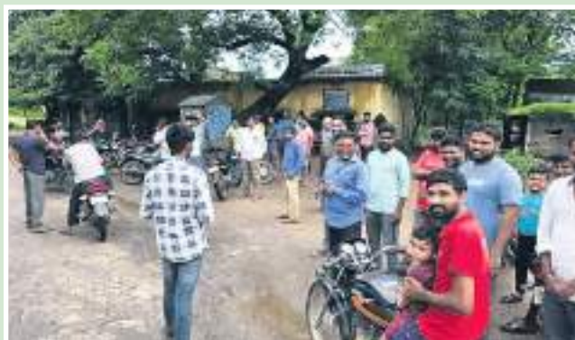
నిరసన వ్యక్తం చేస్తున్న ప్రజలు

జిల్లా ఆరోగ్యశాఖ అధికారులు, మెడికల్ కౌన్సిల్ అధికారులు ఆర్.ఎం.పి పి.ఎం.పి లను తనిఖీలు చేస్తూ భయాందోళనకు గురి చేస్తున్నారు. ఆర్.ఎం.పి , పి ఎం పి వైద్యులు గ్రామాల్లో ఇంజక్షన్లు వేయొద్దు.. మందులు రాయొద్దు ... కేవలం ప్రథమ చికిత్స మాత్రమే చేయాలని ఆంక్షలు పెడుతున్నారు. గ్రామీణ వైద్యులుగా కొన్నేళ్లుగా ఉంటూ ఉపాధి కొనసాగిస్తున్నారు. ఇప్పుడు ఇలాంటి దాడులు మొదలవడం వలన ఉపాధి కోల్పోవడంతో పాటు ఎలా ముందుకు సాగాలో అని అయోమయంలో పడ్డారు. అంతేకాక గ్రామీణ ప్రజలకు వైద్యం అందించకపోతే ప్రజలు (మగతా 2లో)