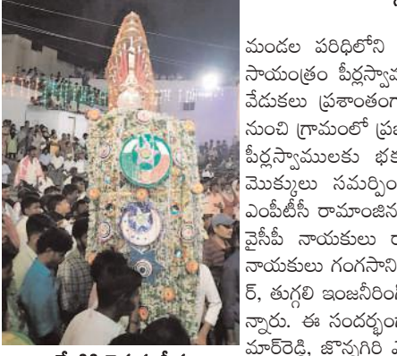
యేటికి వెళ్తున్న పీర్లు