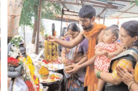
శ్రీవేదవ్యాసుల విగ్రహానికి పూజలు చేస్తున్న యోగానంద కుటుంబ సభ్యులు