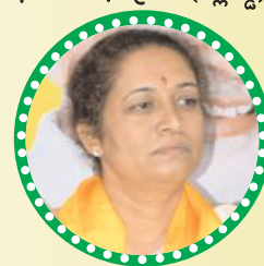
గారు చరిత (పాణ్యం)