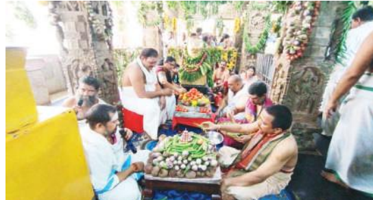
కామేశ్వరి అమ్మవారి ఆలయంలో పూజలు నిర్వహిస్తున్న దృశ్యం