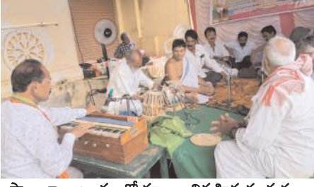
సాయిబాబా ఆలయంలో పూజలు నిర్వహిస్తున్న దృశ్యం

మహానంది, మేజర్ న్యూస్: మహానంది మండలంలో వెలసిన సాయి నాధుని ఆలయాలు భక్తులతో కళకళలాడాయి. ఆదివారం గురు వౌర్ణమి పర్వదినాన్ని పురస్కరించుకొని వేలాదిమంది భక్తులు సాయినాధునికి ప్రత్యేక పూజలు నిర్వహించారు. మండలంలోని తిమ్మాపురం, గాజులపల్లి అల్లినగరం గ్రామంలో వెలసిన సాయినాధుని ఆలయంలో పూజలతో పాటు సాయినామ సంకీర్తనలు, అన్నదాన కార్యక్రమాలు నిర్వహించారు. బుక్కాపురం నదానంద ఆశ్రమంలో మహానంది సమీపంలోని జనశంకర తపోవనం ఆశ్రమంలో వివిధ ఆశ్రమాలలో గురు పూజోత్సవాలు నిర్వహించారు. సత్సంగాలు నిర్వహించారు.