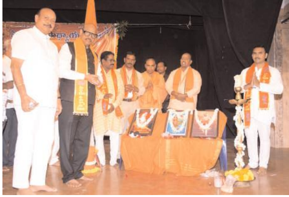
జ్యోతి ప్రజ్వలన చేస్తున్న దృశ్యం