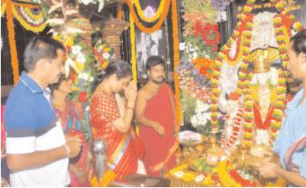
కల్లూరు, మేజర్ న్యూస్:

పూజలు నిర్వహిస్తున్న ఎమ్మెల్యే గౌరవచరితారెడ్డి ఎమ్మెల్యే పాల్గొన్నారు.