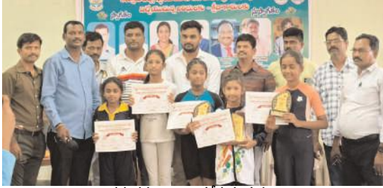
ప్రశంసపత్రాలు అందజేస్తున్న దృశ్యం