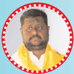
బొగ్గల దస్తగిరి (కోడుమూరు)