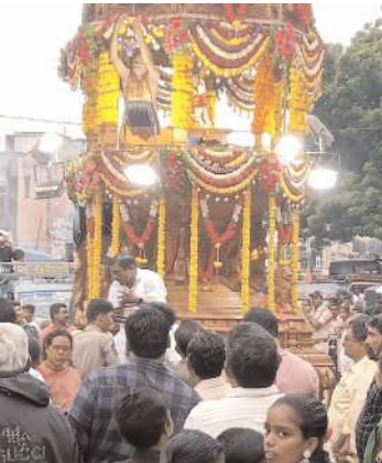
అంగరంగవైభవంగా రథోత్సవాన్ని నిర్వహిస్తున్న దృశ్యం

- సాయి నామస్మరణతో మారుమ్రోగిన ఆలయ ప్రాంగణం - కన్నుల పండుగగా బాబా రథోత్సవం