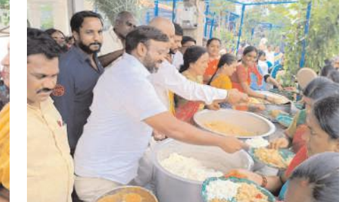
అన్నదానంను ప్రారంభిస్తున్న ఎన్ఎండి ఫిరోజ్