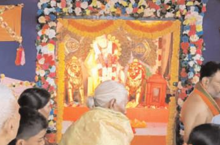
బొమ్మలసత్రం ఆలయంలో బాబాను దర్శించుకుంటున్న భక్తులు