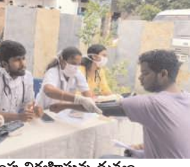
మెడికల్ క్యాంపు నిర్వహిస్తున్న దృశ్యం