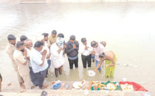
ఎల్ ఎల్ సి కెనాల్ లో గంగమ్మకు పూజలు చేస్తున్న డి.బి. అధికారులు.

ఉండాలని వారు గంగమ్మను కోరుకున్నట్లు తెలిపారు.