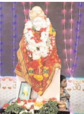
ప్రత్యేక ఆలంకరణలో సాయిబాబా