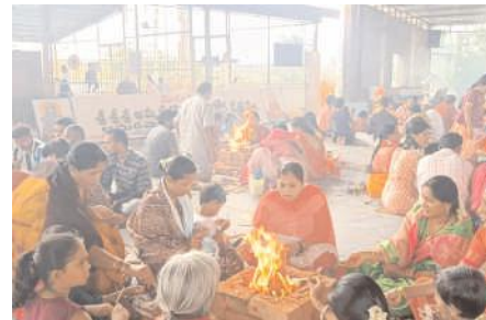
శ్రీఅమరయోగశ్రమంలో హోమాలు చేస్తున్న భక్తులు