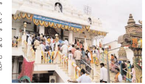
బాబా దర్శనం కోసం వేచివున్న భక్తులు