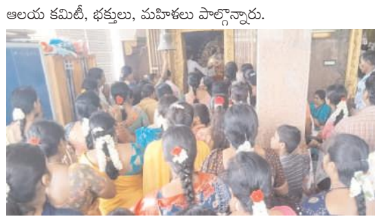
ఆలయ కమిటీ, భక్తులు, మహిళలు పాల్గొన్నారు.