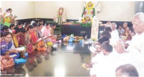
గీతాపారాయణం చేస్తున్న భక్తులు