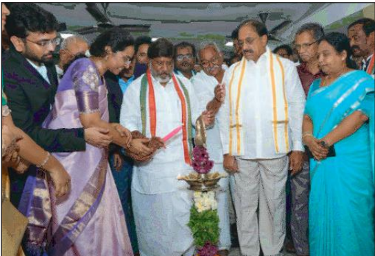
స్తంభాద్రి నూతన హాస్పిటల్ ను ప్రారంభించిన డిప్యూటీ సీఎం మల్లు భట్టి విక్రమార్క, వ్యవసాయ శాఖ మంత్రి తుమ్మల నాగేశ్వరరావు.