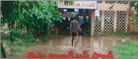
విఎం టుయెట్ బస్ స్టాండ్

పెనుబల్లి మండలంలో విస్తారంగా వర్షాలు కురుస్తున్నాయి. లోతట్టు ప్రాంతాలు వర్షపు నీరు చేరి నిల్వ ఉంటున్నాయి. వైద్య శాఖ అధికారులు దోమల నివారణ పై ఎప్పటికప్పుడు ప్రజలకు అవగాహనలు కల్పిస్తున్నారు. డ్రైడే ఫ్రైడే కార్యక్రమంతో వివిధ గ్రామాల్లో ఇళ్ల పరిసర ప్రాంతాల్లో నీరు నిల్వ ఉండే ప్రదేశాలు పరికరాలను తుతూ మంత్రంగా శుభ్రం చేసి డ్రైనేజీలలో బ్లీచింగ్ చల్లి మమా అనిపిస్తున్నారు.