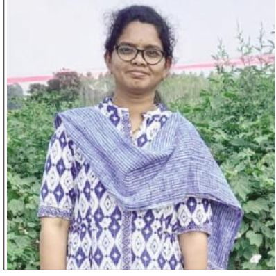
వేదికల్లో మరింత సాంకేతికను సంతరించుకోనున్నాయి. రైతులు శాస్త్రవేత్తలు, వ్యవసాయ శాఖ అధికారులతో నేరుగా మాట్లాడుకునేందుకు తెలంగాణ రాష్ట్ర ప్రభుత్వం వీడియో కాన్ఫరెన్స్ సిస్టమును అందుబాటులోకి

తీసుకువచ్చారు. వీటి ద్వారా కాలానుగుణంగా పంట సాగు రంగంలో పాటించవలసిన పద్ధతులు, నూతన పండ్లూ, సలహాలు, సూచనలు తీసుకునేందుకు వీలుగా ఉంటుంది. మండల కేంద్రంలోని రైతు వేదికలో నూతనంగా వీడియో కాన్ఫరెన్స్ సిస్టమును ఏర్పాటు చేశారు. ఆ సిస్టమును గురువారం సాయంత్రం ప్రారంభిస్తున్నారు.