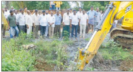
కాంగ్రెస్ ప్రభుత్వం రైతు ప్రభుత్వం