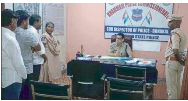
విద్యాసంస్థల్లో యాంటీ డ్రగ్స్ కమిటీల ద్వారా అవగాహన కార్యక్రమాలు

బాధితుల ఫిర్యాదులపై తక్షణమే స్పందించి న్యాయం జరిగేలా కృషి