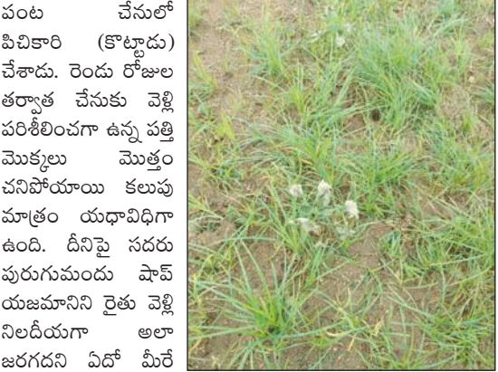
పురుగుమందు షాపు యజమాని నిర్వాకానికి రైతున్నబలి కొన్న మందులకు బట్ట కూడా ఇవ్వనివైనం తనకేం సంబంధం లేదంటూ బుకాయిస్తున్న షాపు యజమాని