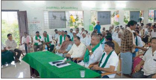
మల్లారం రైతు వేదికలో రైతు రుణమోఫీ సంబరాలు

ఇచ్చిన మాటకు కాంగ్రెస్ కట్టుబడి ఉంటుంది (వీడియో కాన్ఫరెన్స్ లో రైతులతో ముఖ్యమంత్రి రేవంత్ రెడ్డి)