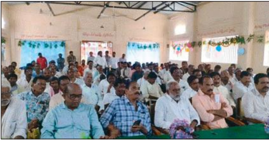
రైతులకు ఇచ్చిన మాట నిలబెట్టుకున్న కాంగ్రెస్ ప్రభుత్వం...