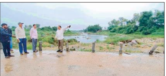
కాక్ వే గ్రామాల ప్రజలపై ప్రత్యేక దృష్టి సారించాలి