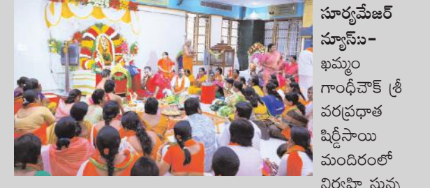
సూర్యమేజర్ స్వ్యాస్ :- ఖమ్మం గాంధీచౌక్ శ్రీ వరప్రధాత ప్షిరీసాయి మందిరంలో నిర్వహిస్తున్న