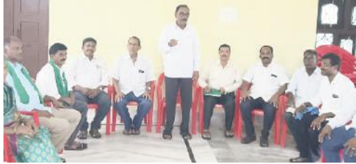
-వర్షాలకు పంట నష్టపోయిన రైతులకు నష్టపరిహారం ఇవ్వాలి