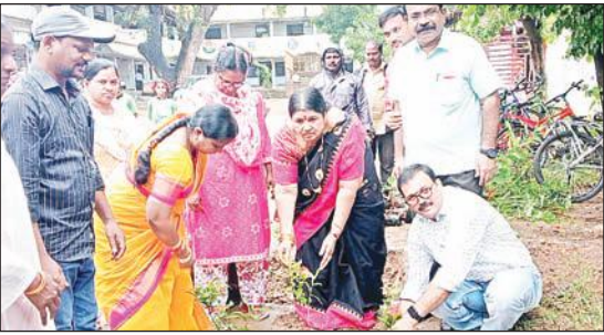
మొక్కలు విరివిగా పెంచుదాం సంపూర్ణ ఆరోగ్యంతో ఉందాం