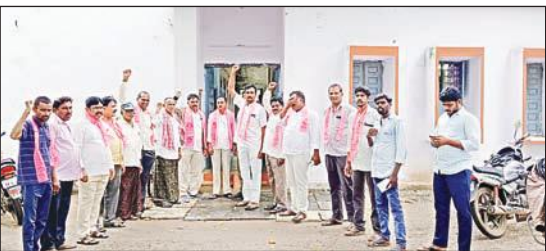
- పహాణీల ద్వారా తీసుకున్న రుణాలను కూడా రద్దు చేయాలి