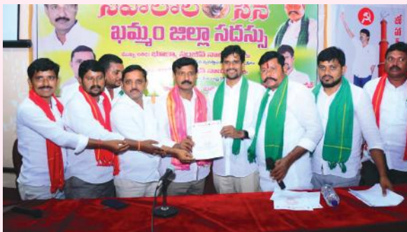
ఏనుగు సూర్య మేజర్ స్టూస్:

-మూడో సారి ఏకగ్రీవంగా ఎన్నుకున్న సేవాలాల్ సేన నాయకులు.