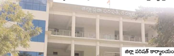
జిల్లా పరిషత్ కార్యాలయం

'కొంతమంది యువకులు ముందు యుగం దూతలు' అన్న శ్రీ శ్రీ మాటలను.. 'ముక్క చుక్క వదిలేసి భవితవ్యం వైపు చుక్కాని అవ్వండి' అన్న వివేకానందుడి మాటలను ఒకసారి మననం చేసుకోవాలి. అఖండ భారత నిర్మాణం కోసం నడుం కట్టి అనుభులు బాసిన యువత నడయాడిన గొప్పదేశం మనది.. అలాంటి దేశంలో కరోజు కొంతమంది యువత గ'మ్మత్తు'గా బ్రతికేందుకే మొగ్గు చూపుతుందేమోనన్న సందేహం కలగక మానదు. ఇప్పుడేదే గమ్మత్తు నగరాలను దాటి పట్టణాలు, మండలాలు, గ్రామాలకూ పాకింది. 'యువత చెడిపోయేందుకు కాదేది అనర్థం' అన్న చందంగా చదువుకోవలసిన వయస్సులో చెడు వ్యసనాల బారిన పడుతూ యుక్తవయసులోనే అనారోగ్యాన్ని కొని తెచ్చుకుంటున్న ఉదంతాలు మన కళ్లకు కనిపిస్తున్నాయి. చిన్న పిల్లలు, యువత, వృద్ధులు అనే తారతమ్యం లేకుండా 'నిక్కరు' వేసుకున్న 20