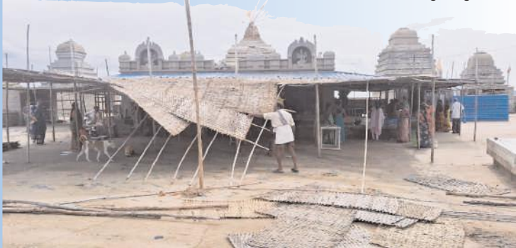
సోమవారం నుండి వరద నీరు వచ్చే అవకాశం ఉండడంతో పంగమేళ్ళు ఆలయం వద్ద చలువ పందిళ్ళను తొలగిస్తున్న దృశ్యం

కర్నూలు, మేజర్ న్యూస్ బ్యూరో : జురాలకు వరద మొదలైంది. బుధవారం కర్ణాటకలోని నారాయణపూర్ డ్యాం 12 గేట్లను తెరిచి దిగువకు 37,260 క్యూసెక్కులు విడుదల చేస్తున్నారు.. దీంతో జురాల ప్రాజెక్టుకు 2,500 క్యూసెక్కులు ఇన్ ఫ్లో నమోదైంది. డ్యాం పూర్తిస్థాయి సామర్థ్యం 9,657 టీఎంసీలకు గాను ప్రస్తుతం