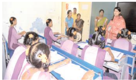
కస్తూరిబా పాఠశాలలో విద్యార్థులతో మాట్లాడుతున్న జిల్లా కలెక్టర్

పరిశీలించి అసంతృప్తి వ్యక్తం చేశారు. రికార్డుల నిర్వహణ సరిచూసుకోవాలని సిబ్బందికి సూచించారు. పిల్లలకు పౌష్టిక ఆహారం అందజేస్తూ మంచి వసతులను కల్పించాలని సూచించారు. - పారిశుధ్య నిర్వహణపై సిబ్బందికి చివాట్లు మండల కేంద్రం అయిన బండిఆత్మకూరులో