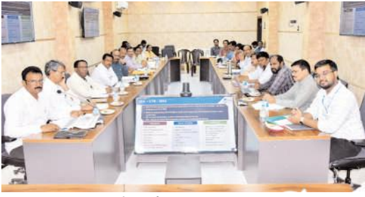
సమావేశంలో హాజరైన అధికారులు