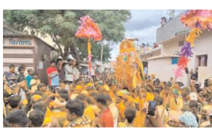
గ్రామాధ్యక్షుల నిర్వహిస్తున్న దృశ్యం

చాగలమర్లమేజర్ న్యూస్ : మండలంలోని ముత్యాలపాడు గ్రామంలో మొహర్రం వేడుకల సందర్భంగా కొలువుదీరిన ప్రధాన పీఠం లాలు స్వామిని గురువారం సాంప్రదాయ బద్ధంగా ఊరేగింపు చేశారు. లాలు స్వామిని పురవీధుల గుండా భారీ జనసందోహం మధ్య హిందూ ముస్లిం సోదరులు పరస్పరంగా ఒకరికి ఒకరు గంధం చల్లుకుంటూ