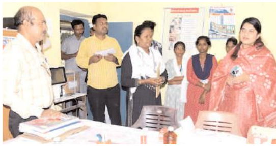
ప్రభుత్వ ఆసుపత్రి ల్యాబును పరిశీలిస్తున్న జిల్లా కలెక్టర్