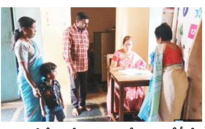
అంగన్వాడి కేంద్రంలో రికార్డులు పరిశీలిస్తున్న ఎంపీడివో

పాములపాడు మేజర్ న్యూస్ : పాములపాడు మండల పరిధిలోని జూలూరు గ్రామ సచివాలయాన్ని గురువారం ఎంపీడివో సరస్వతి తనిఖీ చేశారు. సందర్భంగా సచివాలయంలోని అధికారులను పరిశీలించారు. సమాచారం పై ప్రజలకు అవగాహన కార్యక్రమం చేపట్టాలని సూచించారు. అనంతరం అంగన్వాడి కేంద్రాల నీ తనకి ఇచ్చేసి రికార్డులు పరిశీలించారు. అంగన్వాడి కేంద్రాలు పరిశుభ్రంగా ఉంచుకోవాలని నిబ్బందికి సూచించారు.