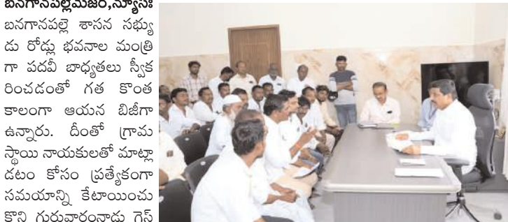
గ్రామస్థాయి నాయకులతో మాట్లాడుతున్న మంత్రి బి.సి