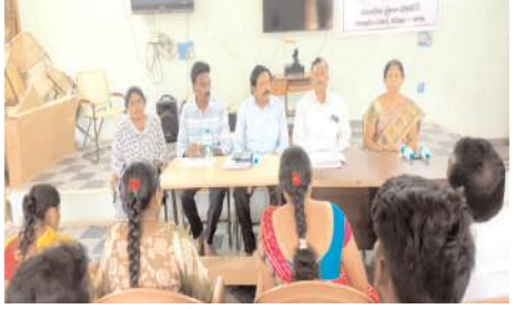
సమావేశం నిర్వహిస్తున్న దృశ్యం