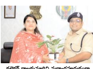
కలెక్టర్ రాజకుమారిని మర్యాదపూర్వకంగా కలిసి పూలమొక్కను సమర్పిస్తున్న ఎస్పీ