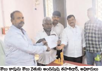
కౌలు కార్డులు కౌలు రైతుకు అందిస్తున్న తహశీల్దార్, అధికారులు

వెల్మర్లమేజర్ న్యూస్: కొందరు రైతులు సాగు చేసుకోవడానికి ఇతర రైతుల నుండి భూమిని కౌలుకు తీసుకొని పంటలను సాగు చేసుకుంటుంటారు, అలాంటి వారికి కూడా ప్రభుత్వం అందించే పథకాలు, సబ్సిడీలు పొందే విధంగా ప్రభుత్వం వారికి కౌలుకార్డులను జారీ చేయడం జరిగిందని తహశీల్దార్ తెలిపారు. గురువారం మండల కేంద్రంలోని తహశీల్దార్ కార్యాలయం నందు మండలంలోని గ్రామ విఆర్ఓలకు, విఆర్ఓలకు, కౌలుకార్డుల జారీ పై సమావేశం నిర్వహించి, అనంతరం కౌలు రైతులకు ప్రభుత్వం నుండి వచ్చిన