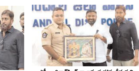
ఎస్పీ అధికారిని రాజకుమారికి పూలబొకెను అందజేస్తున్న ఎన్ఎండి ఫిరోజ్

అధికారిని రాజకుమారి మర్యాదపూర్వకంగా కలిసి పూలబొకెను అందజేశారు. జిల్లాలో శాంతిభద్రతలను పరిరక్షించి ప్రజలు ప్రశాంతంగా జీవించేలా చర్యలు తీసుకోవాలని కోరారు.