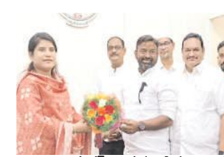
కలెక్టర్ రాజకుమారికి పూలబొకెను అందజేస్తున్న ఎన్ఎండి ఫిరోజ్