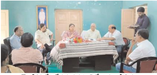
కొన్ని సమావేశాల్లో మాట్లాడుతున్న ఎమ్మెల్యే భూమా అఖిలప్రియ