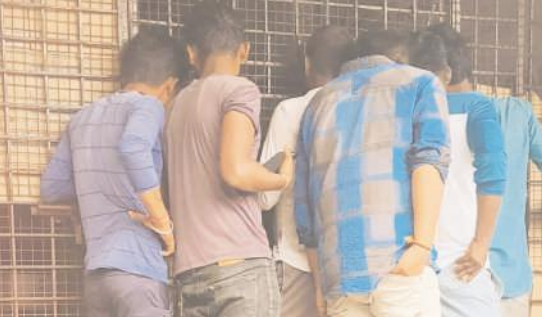
అదోని పట్టణంలోని ఓ వైస్ షాపులో చిన్న మందుబాబులు

గతంలో ఎప్పుడూ లేనంతగా యువత మద్యం మత్తులో ఊగిపోతోంది. ఒకవైపు కుటుంబ ఆర్థిక సమస్యలు, మరోవైపు నిరుద్యోగం వంటి కారణాలతో యువత పెద్దదారి పడుతోంది. చుడుపుకుని ఉన్నత శిఖరాలకు చేరాల్సిన విద్యార్థులలో ప్రారంభంలో కొంతమంది సరదాగా మద్యం తీసుకొంటారు. లేదంటే ఎవరైనా వీరికి బలవంతంగా అలవాటు చేస్తారు. ఆ తర్వాత ఇది చెడు వ్యసనమై మద్యం బానిసలుగా మారి దారి తప్పుతున్నారు. కొందరు పిల్లలైతే మద్యం మత్తులో పట్టణ వీధుల్లో ర్యాష్ డ్రెవింగ్ చేస్తూ.. భయభ్రాంతులకు గురి చేస్తున్నారన్న ఫిర్యాదులు పోలీసులకు స్థానిక ప్రజల నుంచి అందుతున్న పరిస్థితులు ఉన్నాయి. ఇదిలా ఉంటే.. కర్నూలు జిల్లాలో ప్రభుత్వం నిర్వహిస్తున్న కొన్ని మద్యం షాపులలో నిబంధనలకు విరుద్ధంగా మద్యం విక్రయాలు కొనసాగిస్తున్నాయని బాహుళంగా వినిపిస్తున్న మాట. 21 సంవత్సరంలోపు వున్నవారికి మద్యం విక్రయించకూడదు అన్న ప్రభుత్వ నిబంధనలను మద్యం షాపుల