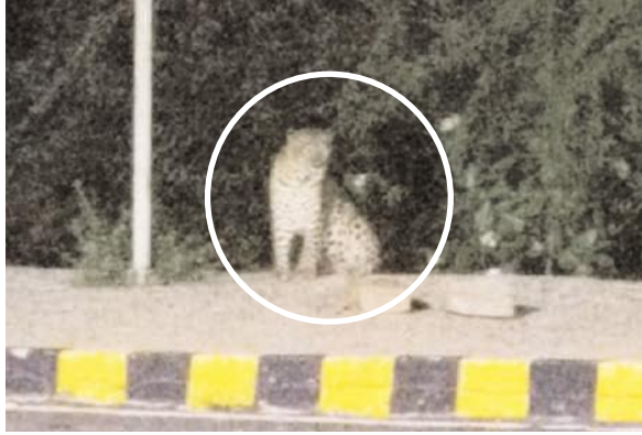
శ్రీశైలంలో చిరుత సంచరిస్తున్న దృశ్యం