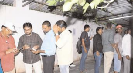
సెల్ ఫోన్ లో బిల్లులు కడుతున్న ప్రజలు

కర్నూలు సీటీ, మేజర్ న్యూస్: ప్రజలు విద్యుత్ బిల్లులను చెల్లించడానికి గంటల తరబడి క్యూ లైన్ లో నిలబడాల్సిన పరిస్థితి ఏర్పడింది. ఏపీఎస్ టిడిసీఎల్ యాప్ పనిచేయకపోవడంతో ప్రజలు పనులు మానుకొని క్యూలైన్ లలో వేచి ఉండాల్సి వస్తుంది. గతంలో ఫోన్ పే, గూగుల్ పే, పీటీఎం వంటి యూపీఐల ద్వారా ప్రజలు క్షణాల్లో విద్యుత్ బిల్లులను